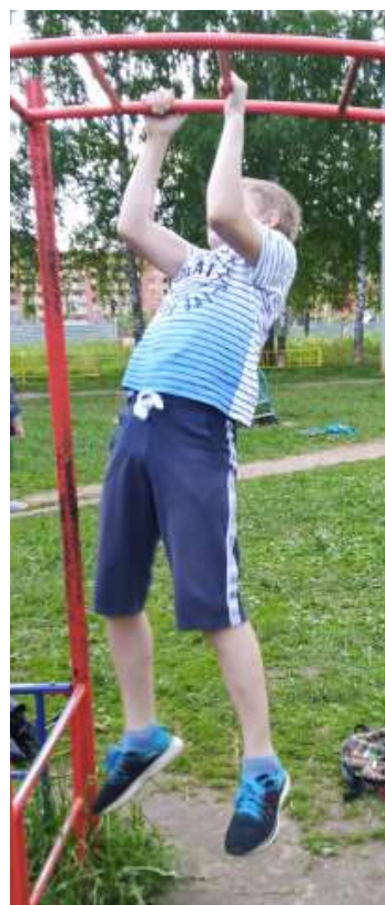
Скоростно-силовая тренировка на турнике.