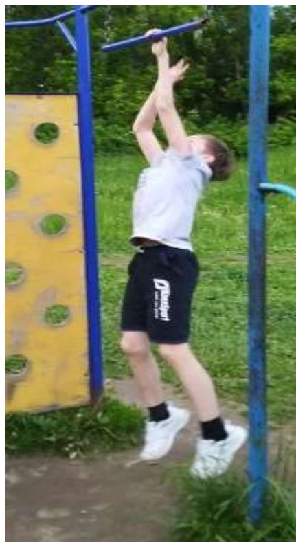
Индивидуальные тренировки. Скоростно-силовая тренировка на турнике.