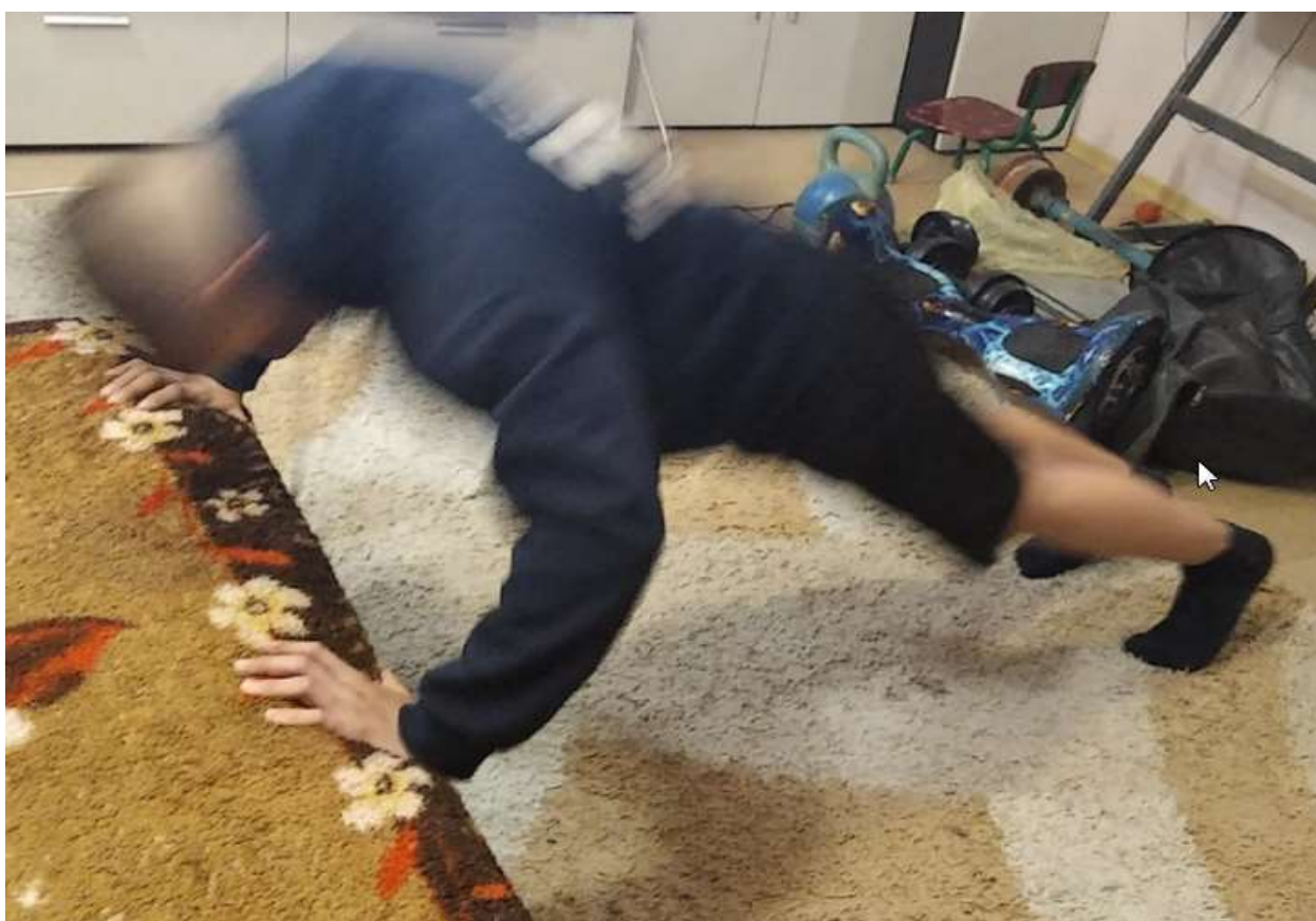
Индивидуальные тренировки в домашних условиях. Силовая тренировка.