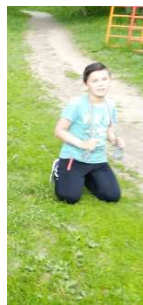
Индивидуальные тренировки на открытых площадках. Силовая тренировка с резиновым жгутом.