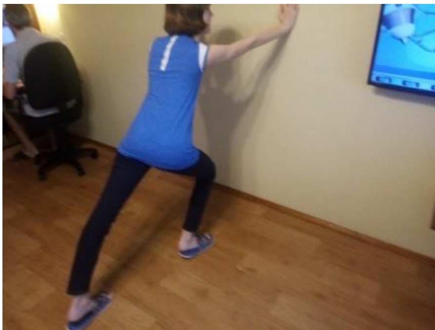
Упражнение для кистей рук