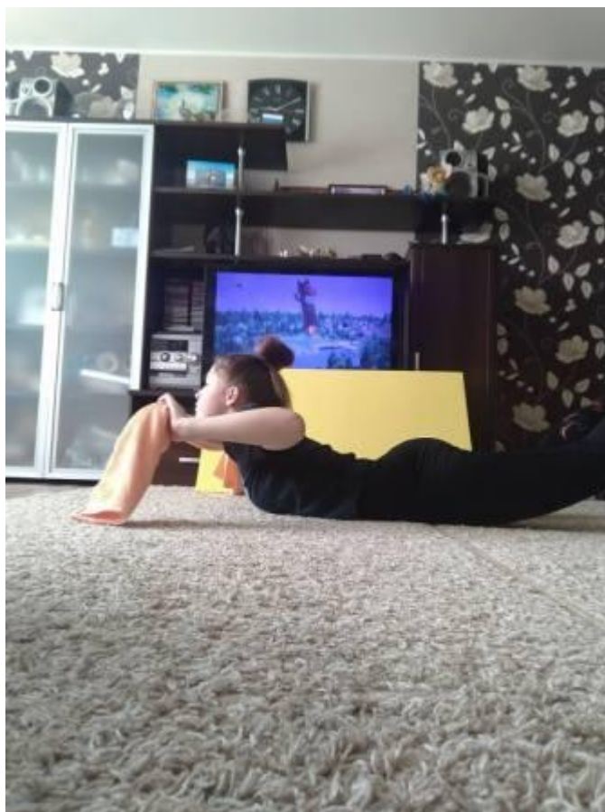
Упражнение для мышц спины