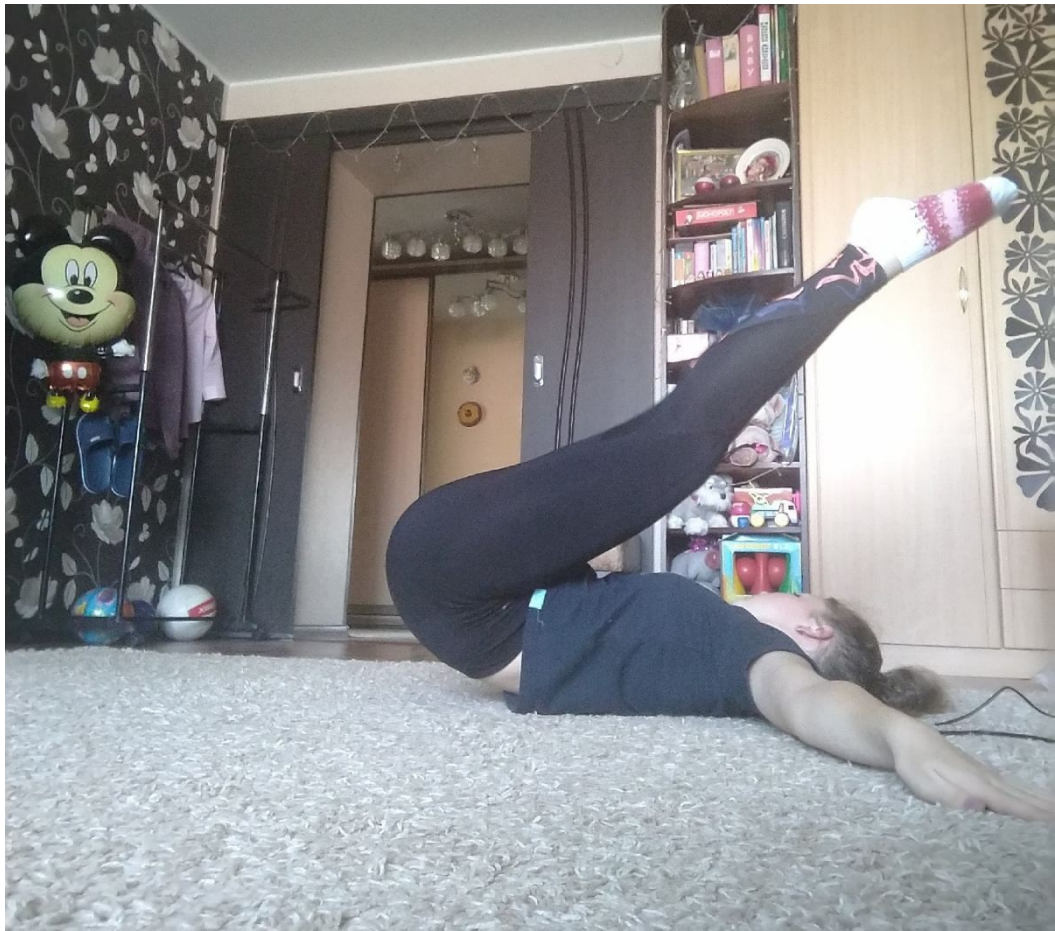
Упражнения для мышц брюшного пресса