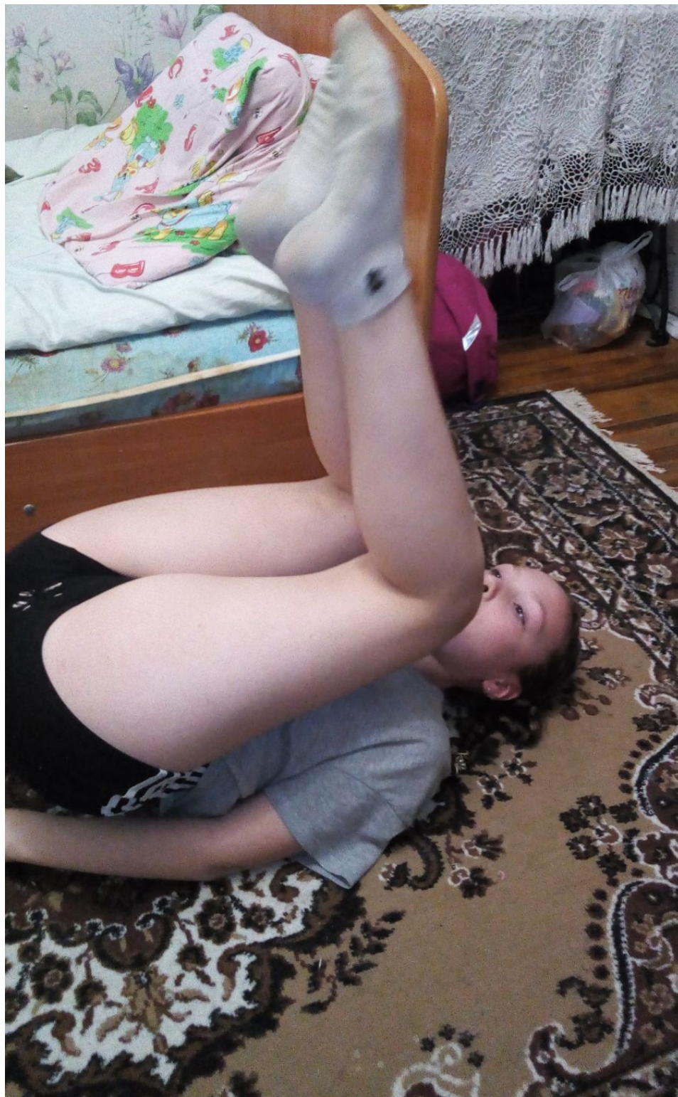
Упражнения для мышц брюшного пресса