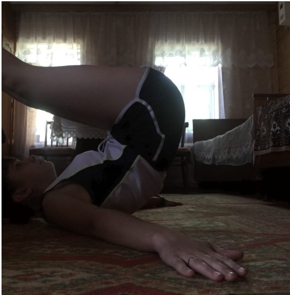
Упражнения для мышц брюшного пресса