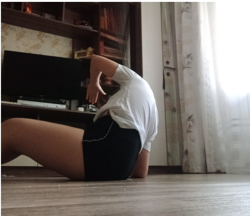
Упражнения для косых мышц живота