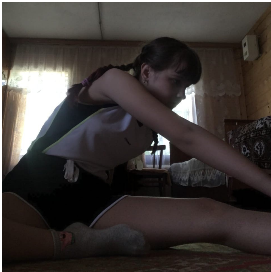
Упражнения на гибкость