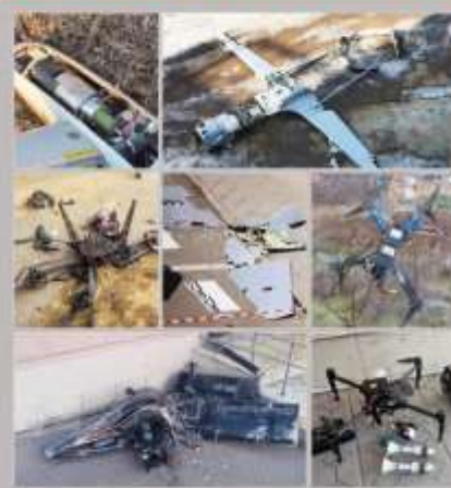
Фотографии обломков/фрагментов БПЛА