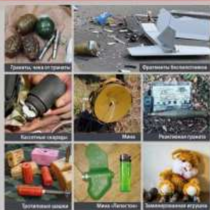
Фотографии взрывоопасных предметов