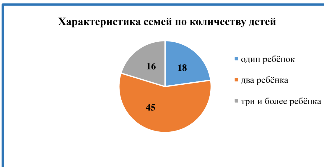
Диаграмма 5: Характеристика семей по количеству детей

Контингент воспитанников социально благополучный.