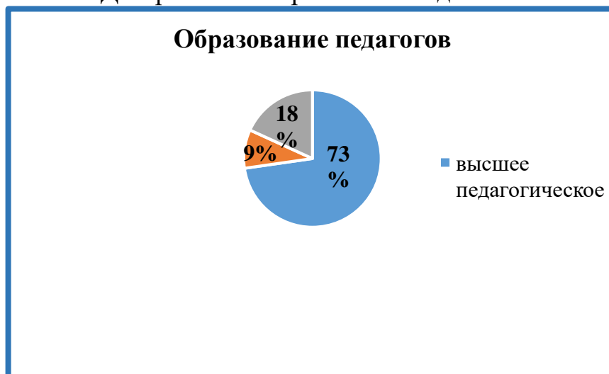
Диаграмма 6. Образование педагогов

Педагоги детского сада регулярно проходят процедуру аттестации: