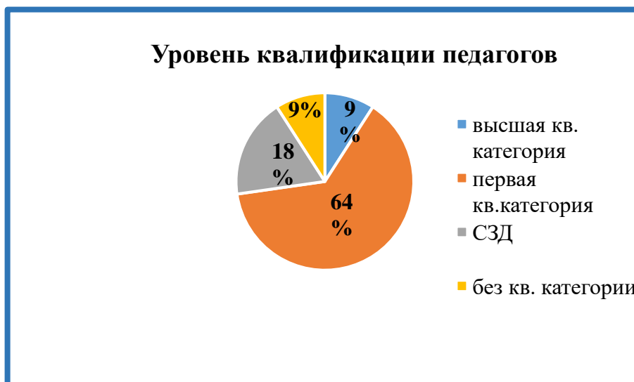
Диаграмма 7. Уровень квалификации педагогов

Стажевые показатели педагогических работников имеют следующие показатели: