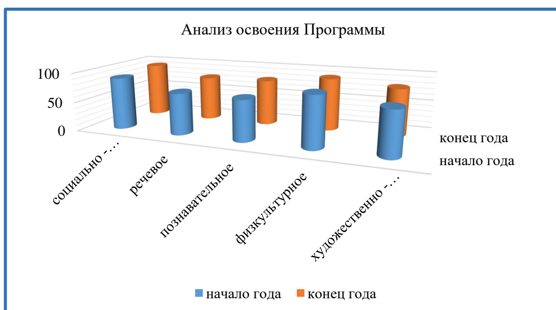
Диаграмма 2: Динамика освоения программы за три года