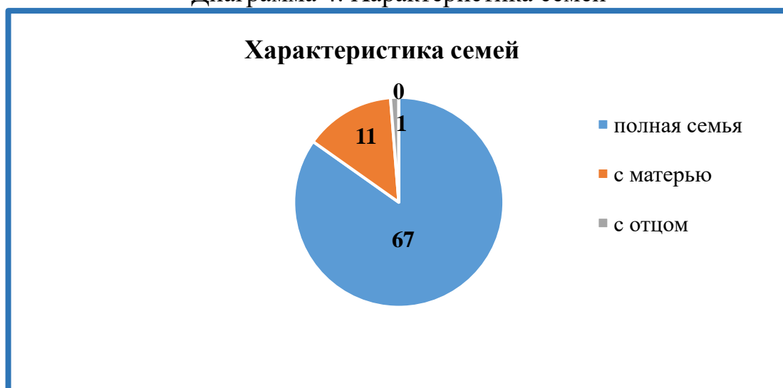
Диаграмма 4: Характеристика семей