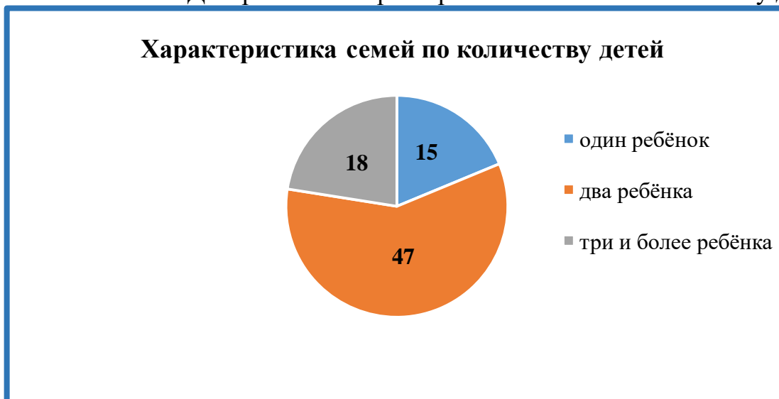
Диаграмма 5: Характеристика семей по количеству детей

Контингент воспитанников социально благополучный.