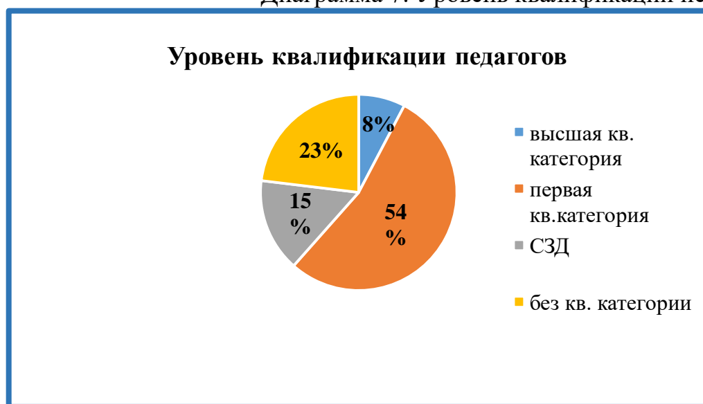
Диаграмма 7. Уровень квалификации педагогов

Стажевые показатели педагогических работников имеют следующие показатели: