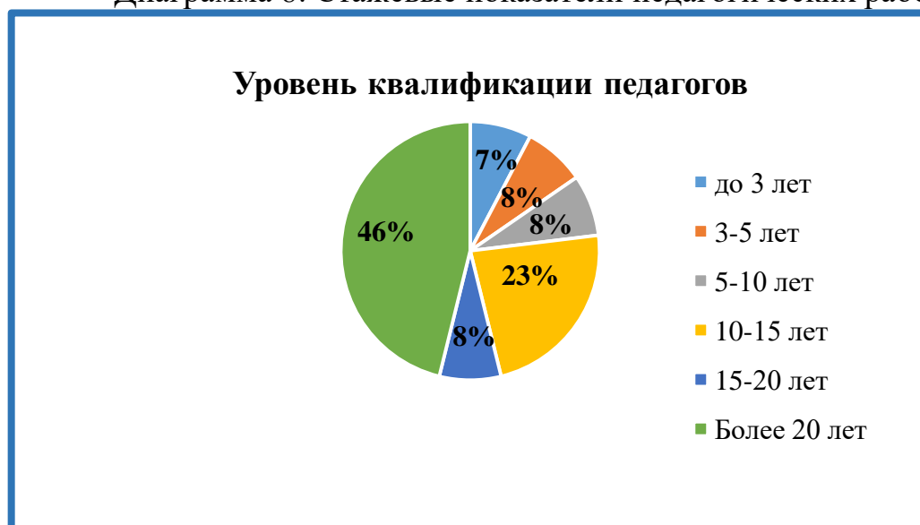
Диаграмма 8: Стажевые показатели педагогических работников

Вывод: у 1 педагога имеется высшая квалификационная категория, что в процентном соотношении составляет 8 %. 7 педагогов из 13 имеют 1 квалификационную категорию, что в процентном значении составляет 54 %, 2 педагога имеют СЗД, что в процентном значении составляет 15 % и у 3 педагогов отсутствует квалификационная категория, что в переводе на процентное значение составит 23 %.