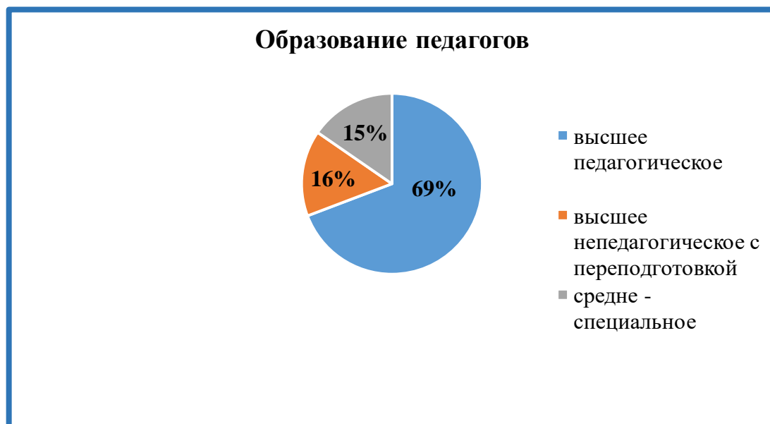
Диаграмма 6. Образование педагогов

Педагоги детского сада регулярно проходят процедуру аттестации: