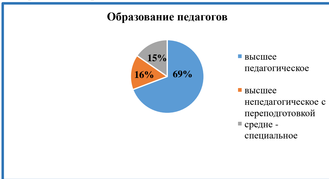
Диаграмма 6. Образование педагогов

Педагоги детского сада регулярно проходят процедуру аттестации: