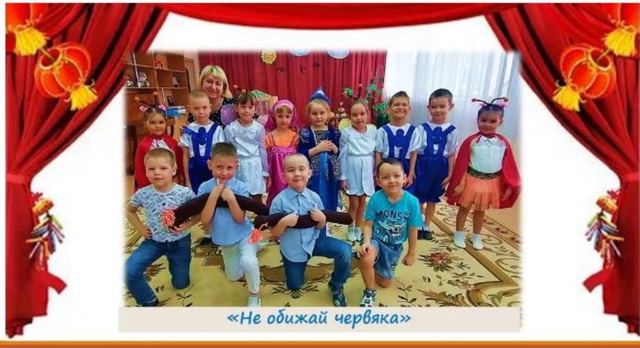
«Не обижай червяка»

Театрализованная деятельность – одна из нетрадиционных форм экологического образования и воспитания детей. Она помогает раскрыть проблемы окружающей среды посредством костюмированных театральных постановок, которые направлены на охрану и бережное отношение к природе. Только через театральную игру у ребенка происходит познание самого себя, других, окружающего мира. Если соединить два разных направления: экологические проблемы и театрализованную деятельность получается – экологический театр . Так и в нашем детском саду воспитатели вложили большой труд в развитие экологической культуры через театрализованную деятельность.