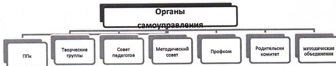
Рисунок 2. Органы самоуправления

В ДОУ согласованно работают различные органы самоуправления: методический совет, родительский комитет, профсоюзный комитет (рис. 2). С детьми и родителями группы риска работает Совет профилактики. Организует работу с детьми с ОВЗ, с детьми, нуждающимися в логопедическом и психологическом сопровождении, детьми-инвалидами психологопедагогический консилиум (ППк). Методический совет занимается инновационными процессами в ДОУ, помогает педагогам пройти процедуру аттестации. Родительский комитет участвует в решении множества актуальных вопросов и помогает этим и детскому саду, и своим детям.