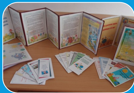
Перечень программ и технологий по образовательным областям