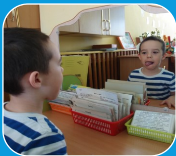
Условия реализации Программы