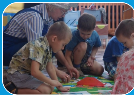
Организация образовательного процесса