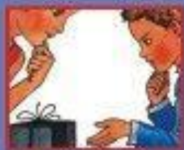
В МАГАЗИНЕ. ПРОДАВЦУ