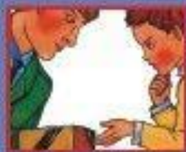
В ТРАНСПОРТЕ. ВОДИТЕЛЮ