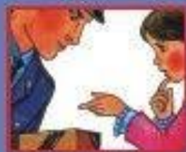
НА УЛИЦЕ ИЛИ В МЕТРО- ПОЛИЦЕЙСКОМУ