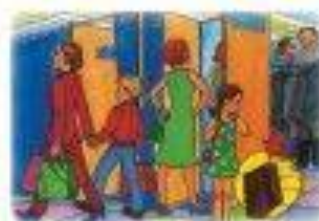
В ОБЩЕСТВЕННЫХ МЕСТАХ