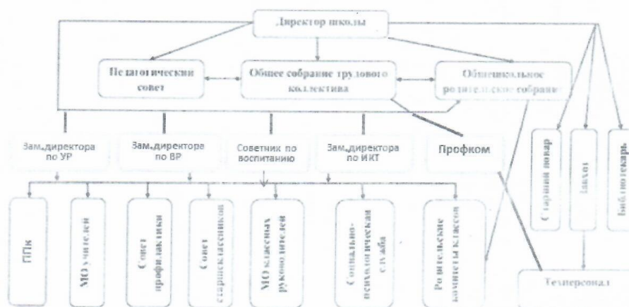
СТРУКТУРА УПРАВЛЕНИЯ ОО