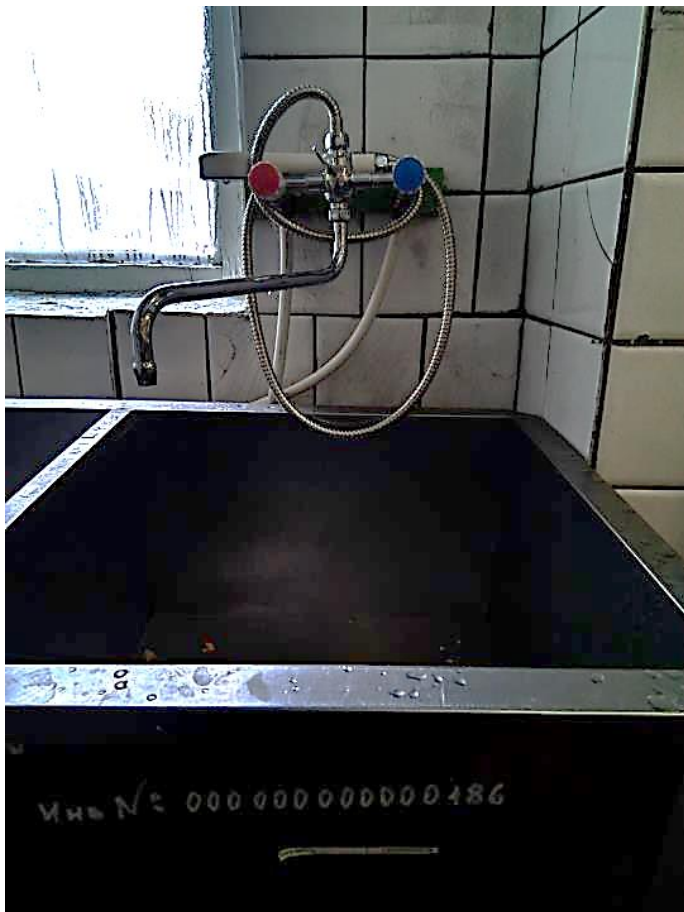
Счет на смеситель и ТЭН для бойлера.