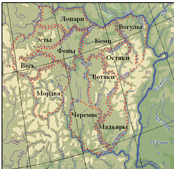
Карта поселений древних финно-угров