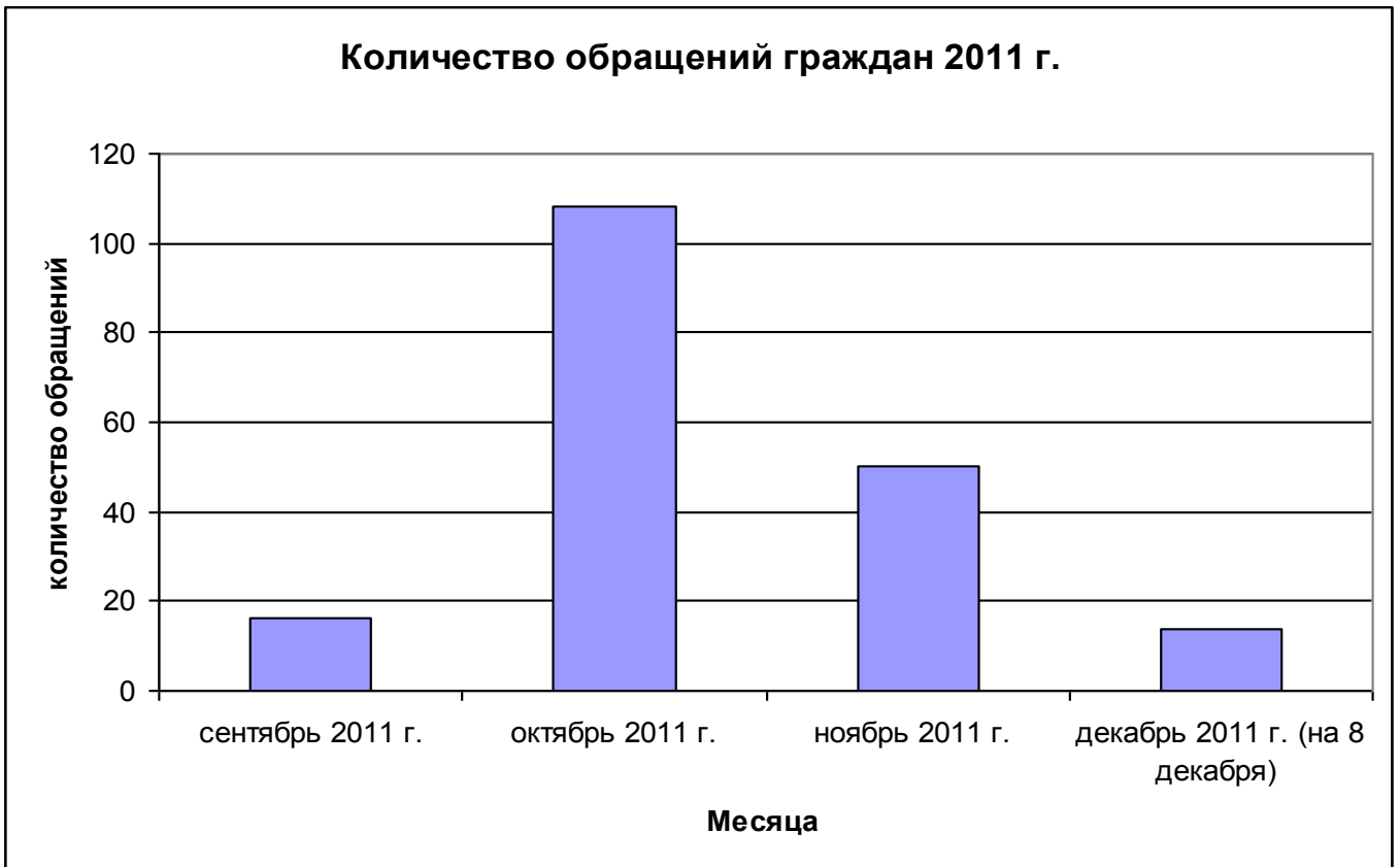
Рис. 1. Количество обращений от граждан Российской Федерации по вопросам выплаты заработной платы учителям общеобразовательных учреждений в 2011 году