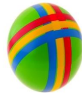
БОЛЬШОЙ И МАЛЕНЬКИЙ