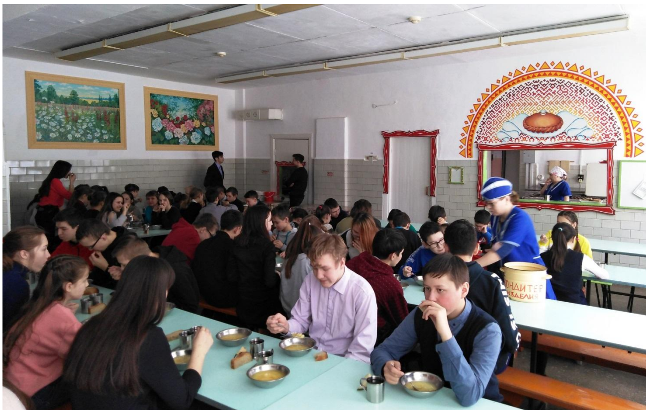
Столовая на 115 посадочных мест

Приём пищи осуществляется в школьной столовой