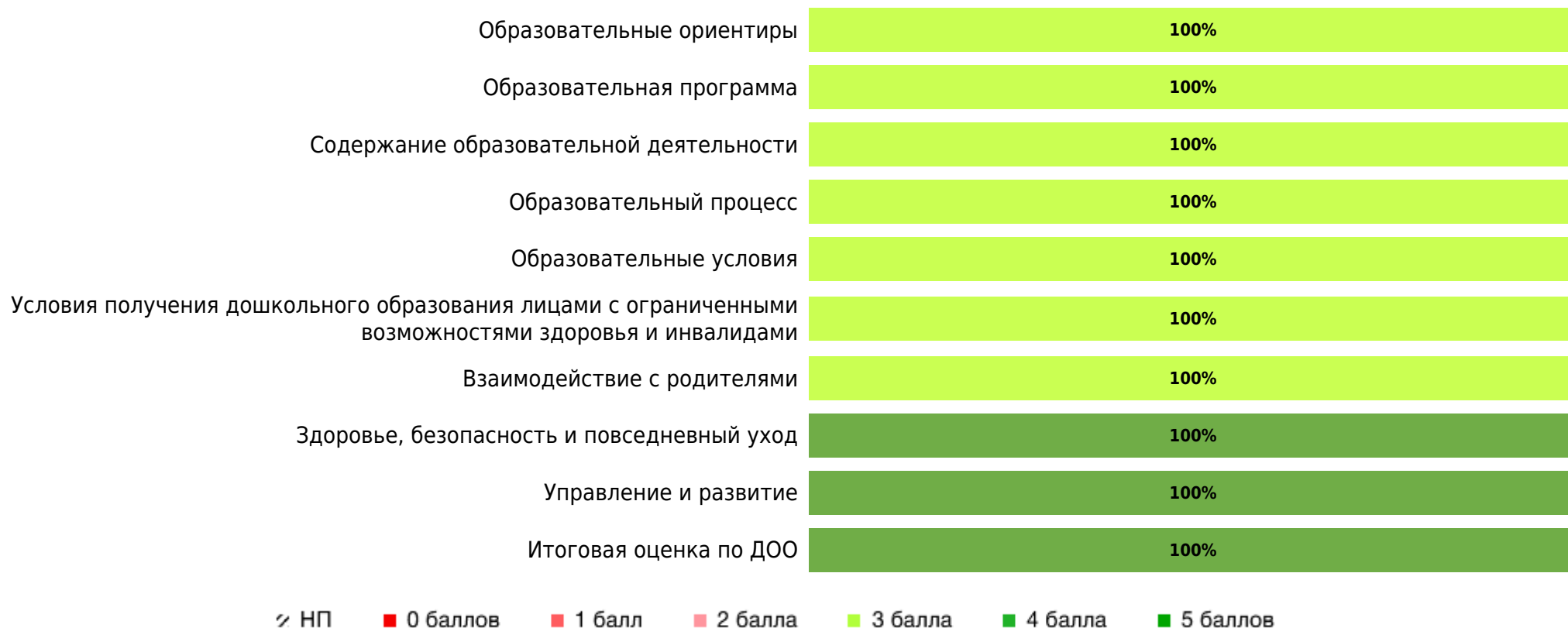
Доли ДОО с разными баллами у педагогов