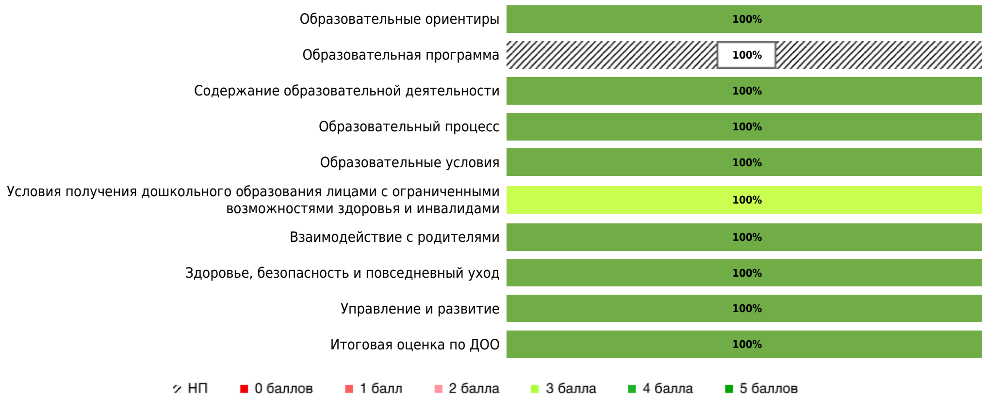
Доли ДОО с разными баллами у их ООП ДО ДОО (самооценка)

В процессе самооценки было оценено 1 ООП ДО ДОО из 1 ДОО субъекта РФ.