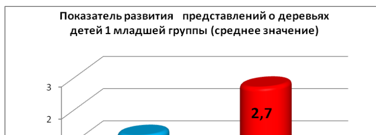
Таблица оценок представлений детей о деревьях у детей 1 младшей группы