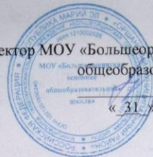
ГРАФИК смены кипяченой воды в МОУ «Большеоршинская основная общеобразовательная школа»