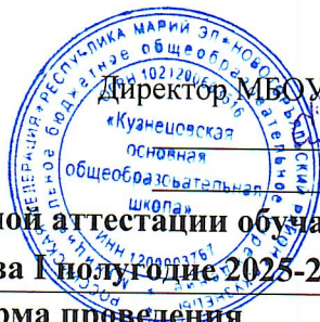
График промежуточной аттестации обучающихся МБОУ «Кузнецовская ООШ» за I полугодие 2025-2026 учебного года