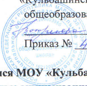
График посещения столовой обучающимися МОУ «Кульбашинская основная общеобразовательная школа» с целью минимизации контактов