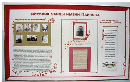
Стенд на стене в школе №23 города Орла