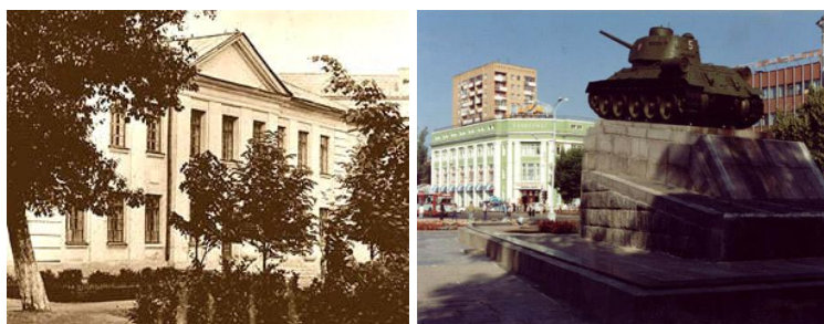
Школа №23 г. Орла на ул. Панчука

С 21 апреля 1961 года пионерская дружина школы №23 г. Орла стала носить имя И.В. Панчука.