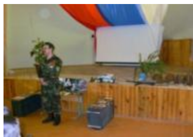
Вахта памяти марийских поисковиков группы «Демос»