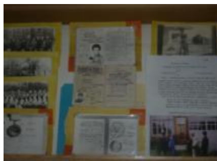
Музейные материалы о его сыне.