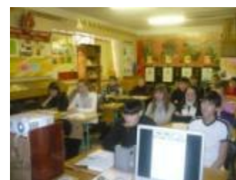
Обсуждение плана работы музея. Очередное занятие в музее школы