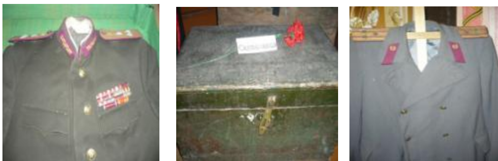
Музейные экспонаты П.И.Курсова