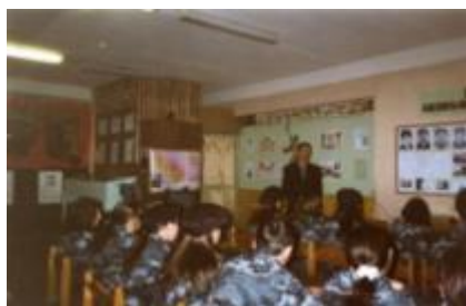
Встречи кадетов с участниками Чеченской и Афганской войны.