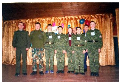
Встреча с участниками локальной Чеченской войны