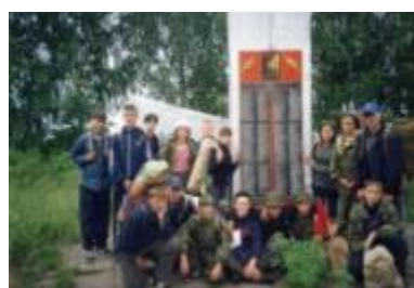
Встречи в музее во время похода по Волжскому району