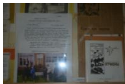
Стенды об участниках Афганской войны в музее школы. Встреча с родителями и участниками локальных войн.