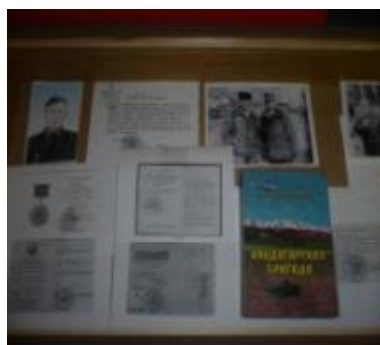
Летние походы в целях сбора материалов о воинах Афганцев.