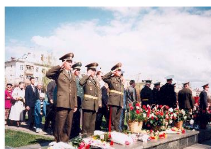
Кадеты в дни Вахты памяти 9 мая