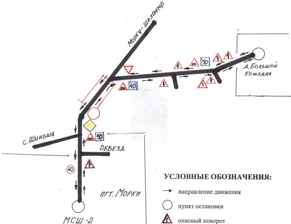
СХЕМА МАРШРУТА ДВИЖЕНИЯ С УКАЗАНИЕМ ЛИНЕЙНЫХ ДОРОЖНЫХ СООРУЖЕНИЙ И ОПАСНЫХ УЧАСТКОВ