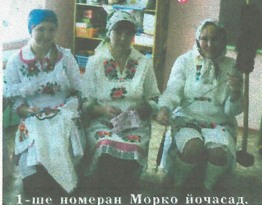
1-ше номеран Морко йочасад.

Группыштына «Ковай деке унала» занятийым эртарышна. Унала ава-кова-влак толыныт. Нуно тۇрым тўрленят, пижым пидыныт, ургеныт, а ковай межым шўдыраш туныктен. Йоча-влак туштылан вашмутым кычалыныт, калык модыш дене модыныт, марла почеламутым лудыныт.