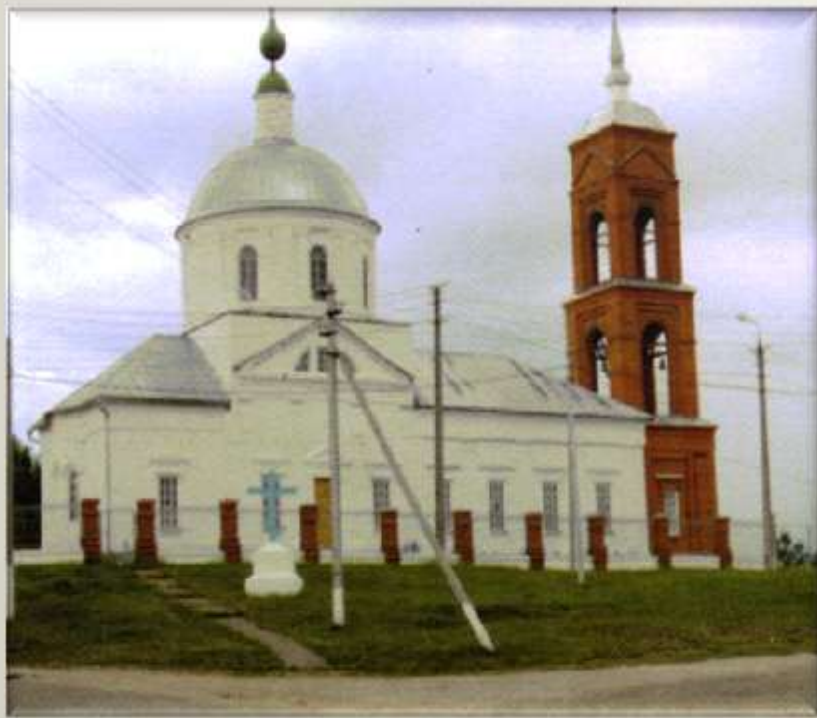
Богоявления Христова черке. Тудым 1752 ийыште почмо. Кермыч гыч 1819 ийыште чонымо.