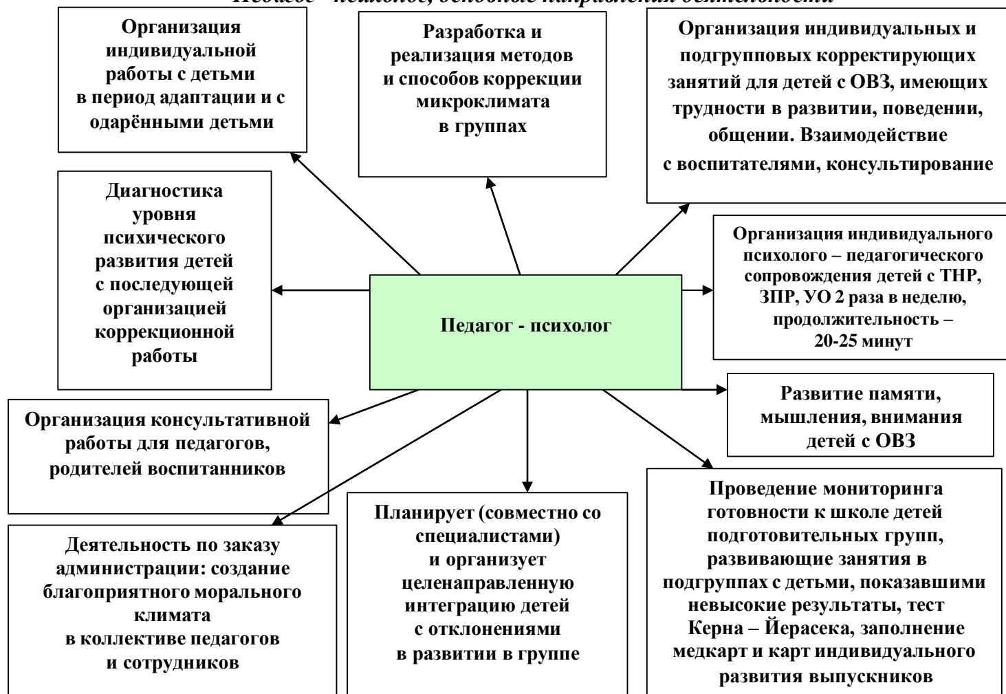
Рис. 2 «Педагог - психолог, основные направления деятельности»