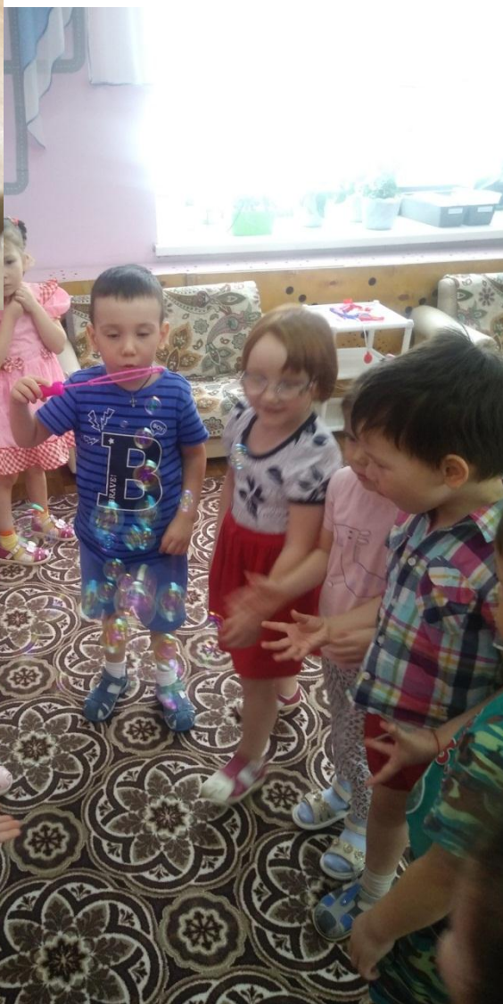
Рис. 11 «Игры с мыльными пузырями»