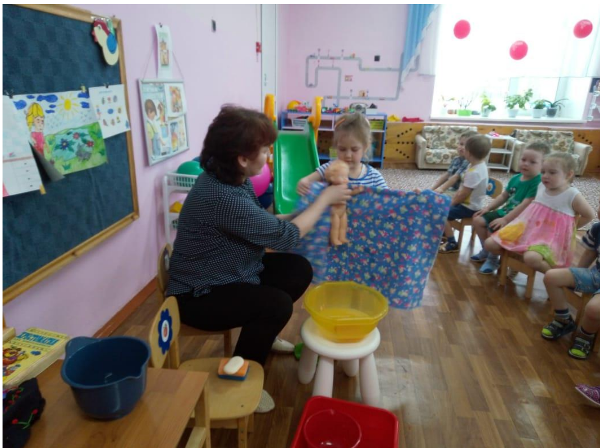
Рис. 8 Д/и «Купание куклы»