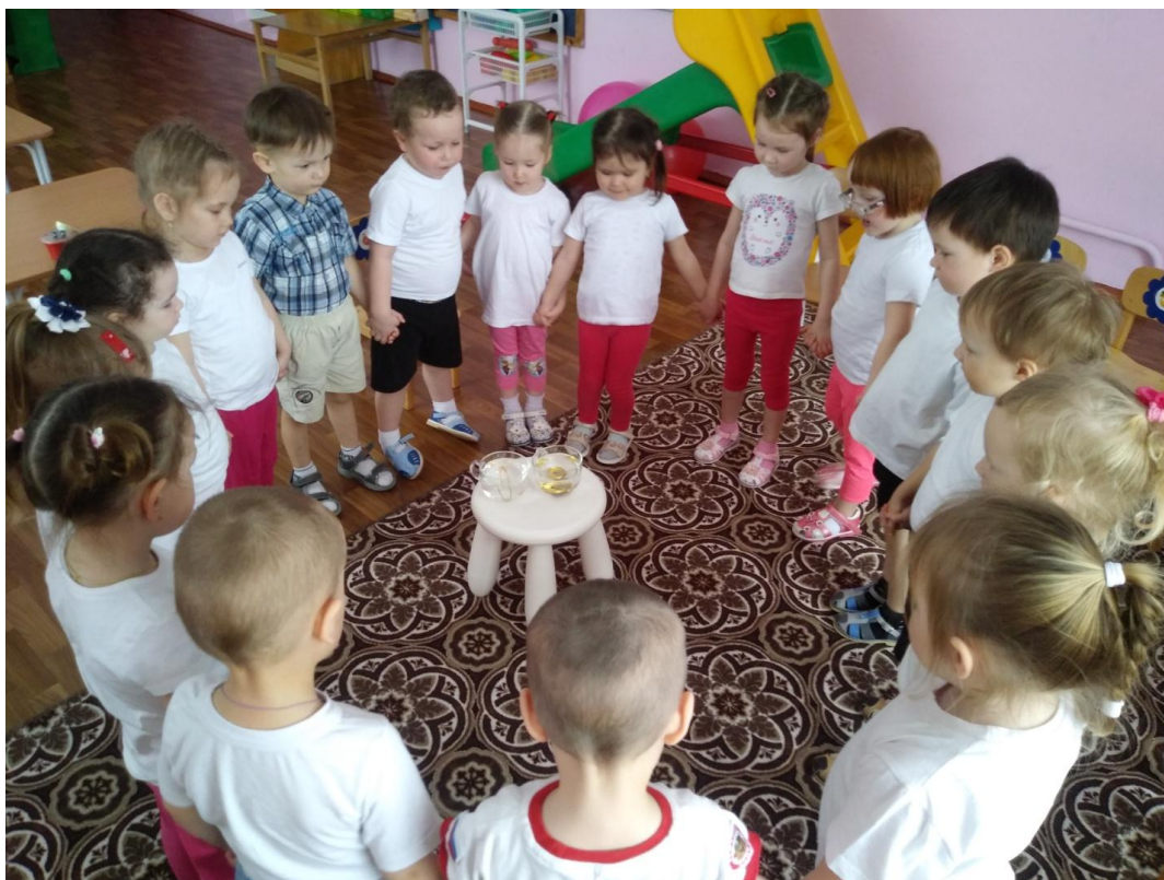
Рис. 4 «Вода прозрачная»