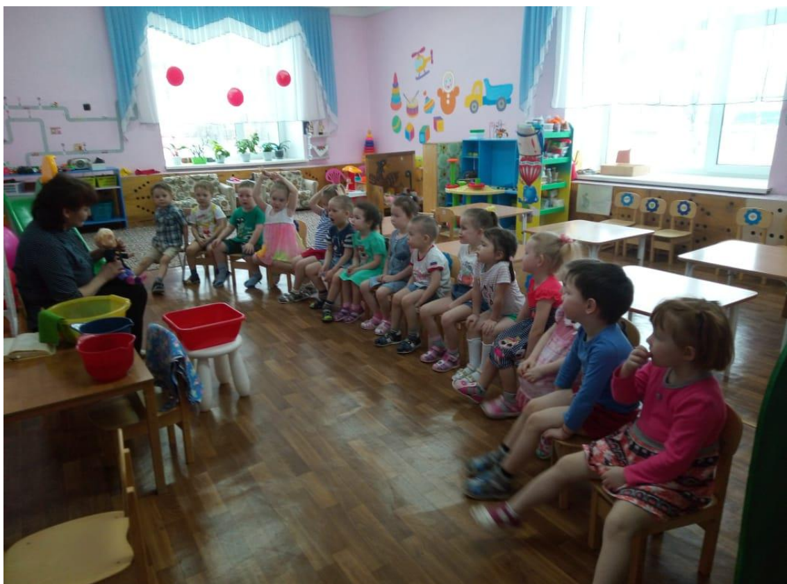
Рис. 7 Чтение художественной литературы