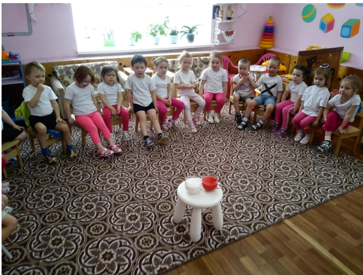
Рис 5. «Воду можно окрасить»