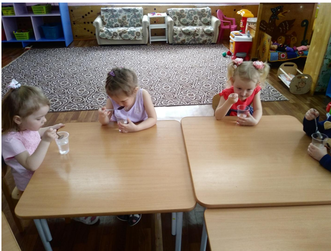
Рис. 1 «У воды нет запаха и вкуса»