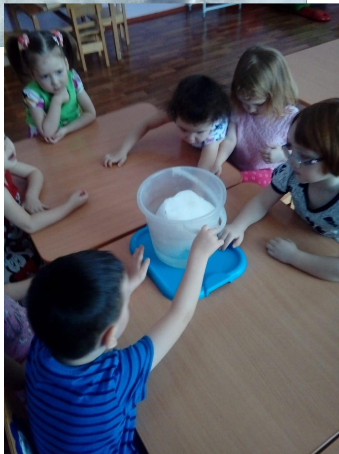
Рис. 4 «Лёд – это вода», «Снег – это вода».