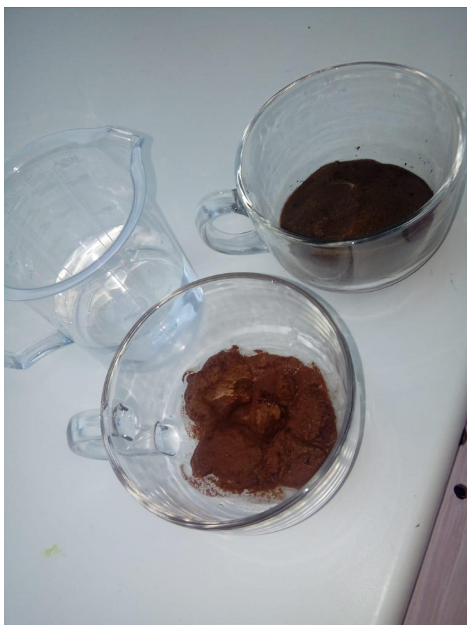
Рис.2 «Что растворяется в воде?»