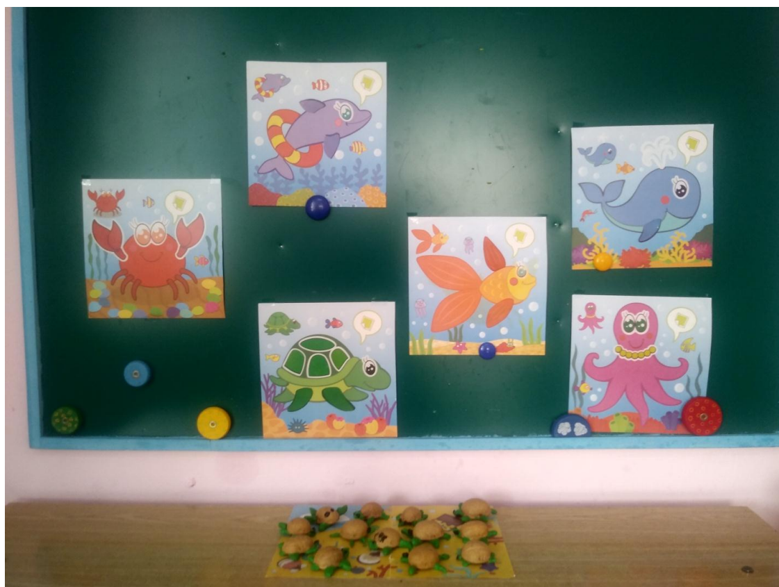
Рис. 10 Лепка черепашек.