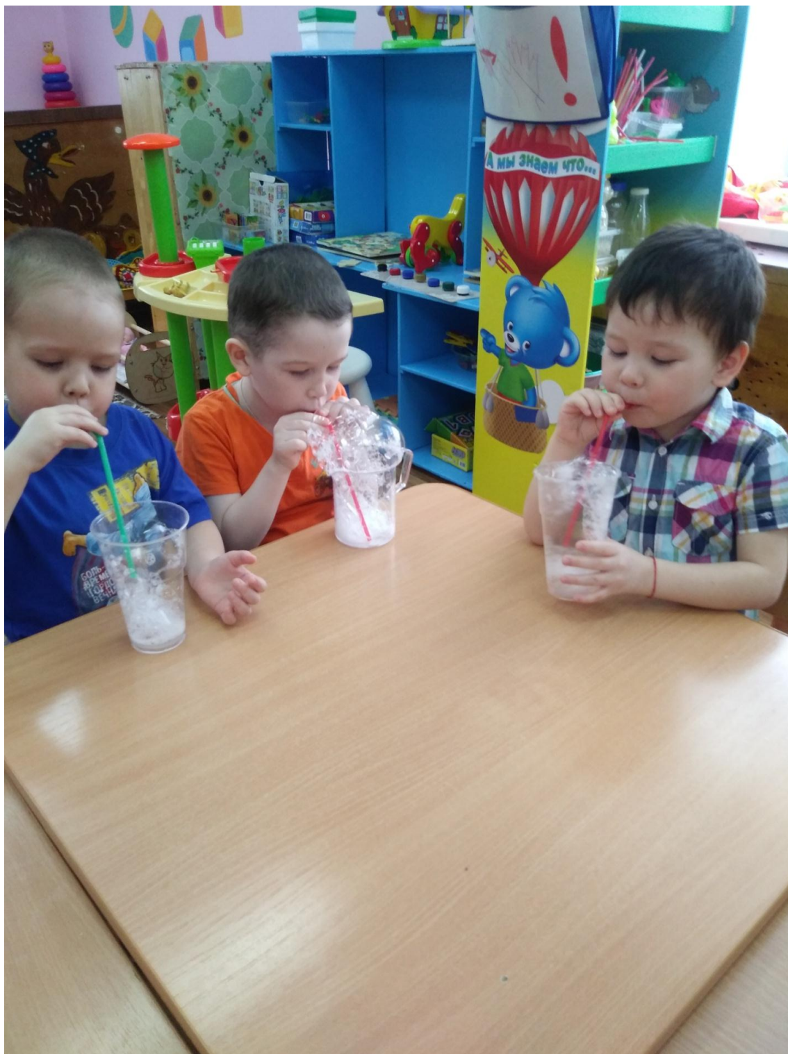
Рис. 12 «Пускание корабликов»