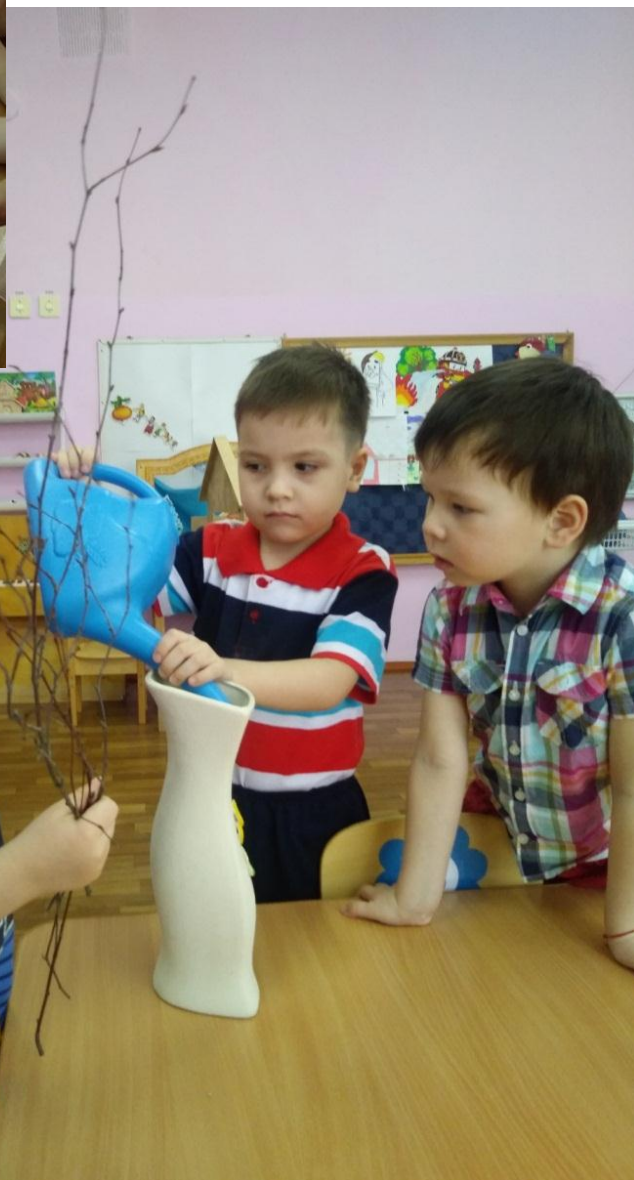
3 Рис. «Вода умеет впитываться», «Как растения пьют воду»