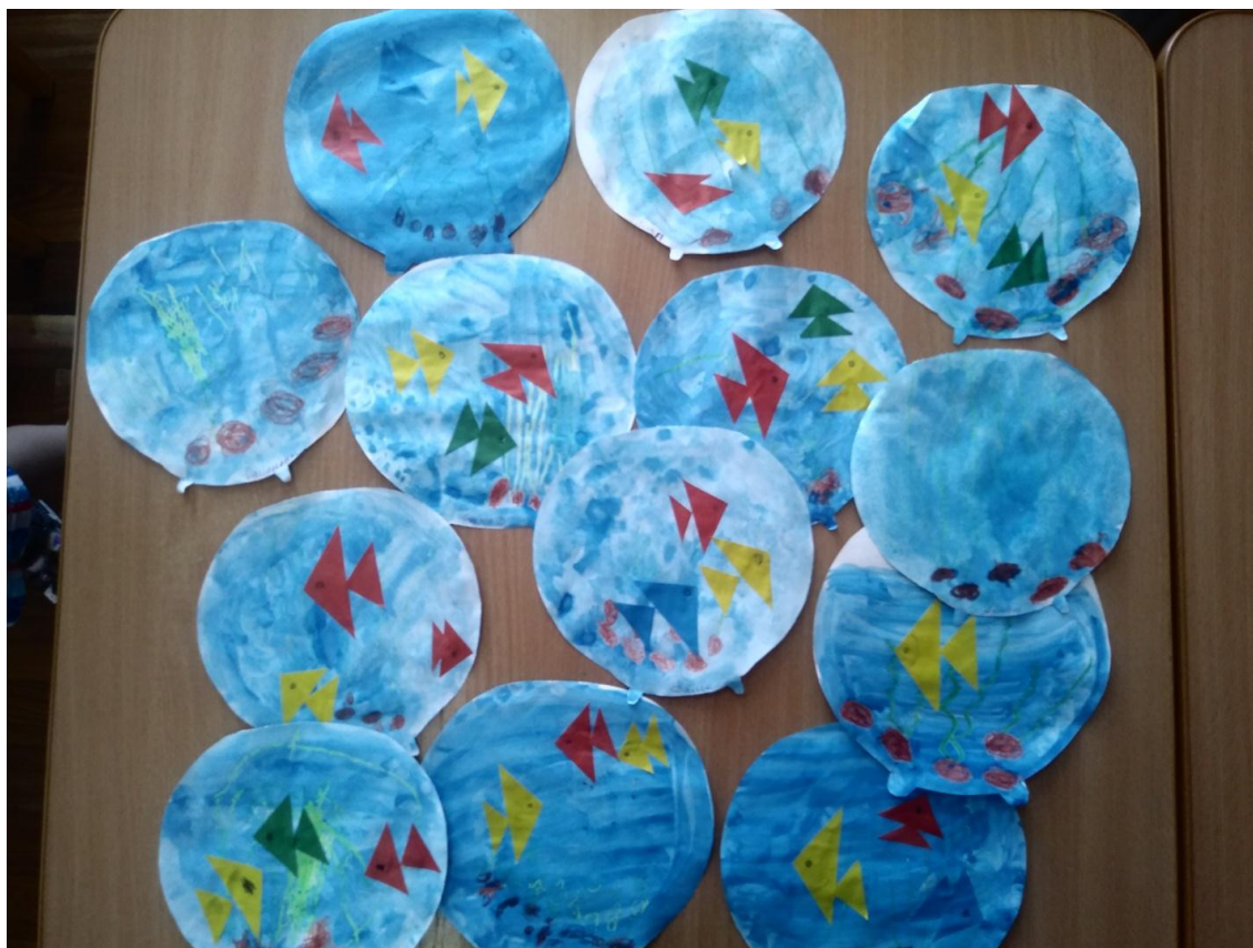
Рис.9 Рисование аквариума. Аппликация рыбок.