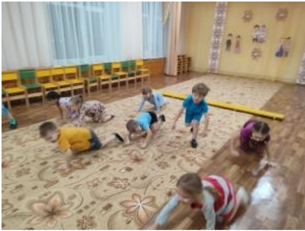
Рис.11. Подвижная игра «Котят и щенят».