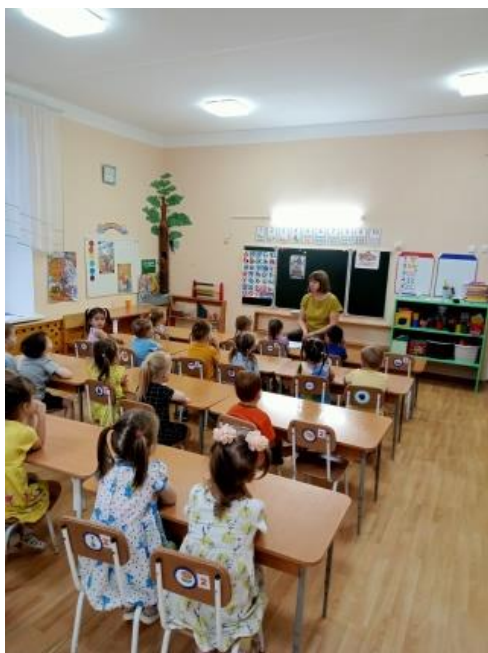
Рис.1. Беседа: «Умейте дружбой дорожить».