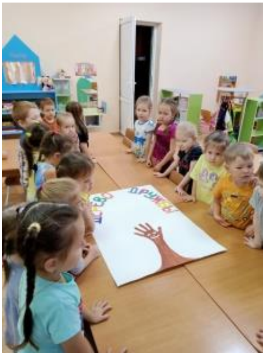
Рис.15. Плакат «Дерево ДРУЖБЫ» (из отпечатков ладошек).