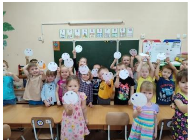
Рис.18. Д/и «Да-да-да. Нет-нет - нет»