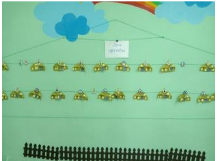
Рис.5. Конструирование «Дом дружбы».