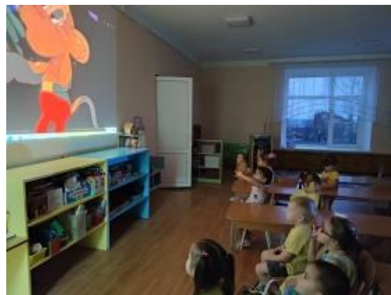
Рис.8. Просмотр мультфильма «Просто так»