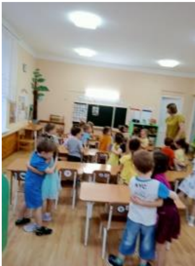
Рис.7. Заучивание «Мирилки».