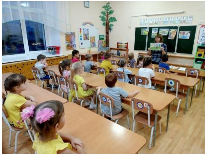
Рис.12. Рассматривание иллюстраций: «Оцени поступок».