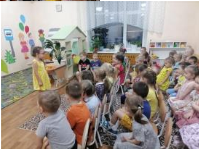
Рис.20. Чтение стихов про дружбу.