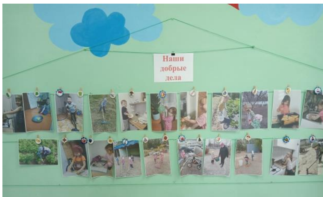
Рис.22 Фотовыставка «Наши добрые дела».