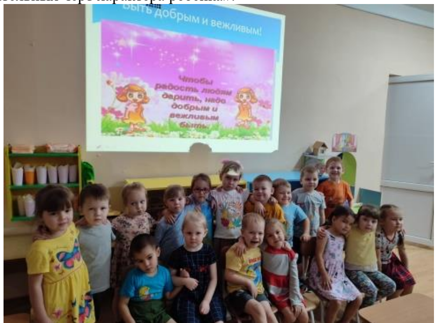
Рис.10 Заучивание и обсуждение пословиц и поговорок о добре, дружбе.