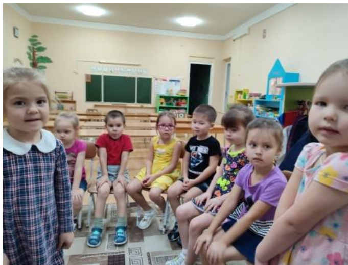
Рис.14. Игра «Комплименты».