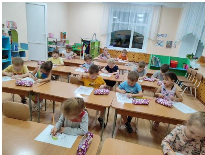
Рис. 17 Рисование – «Рисунок другу».