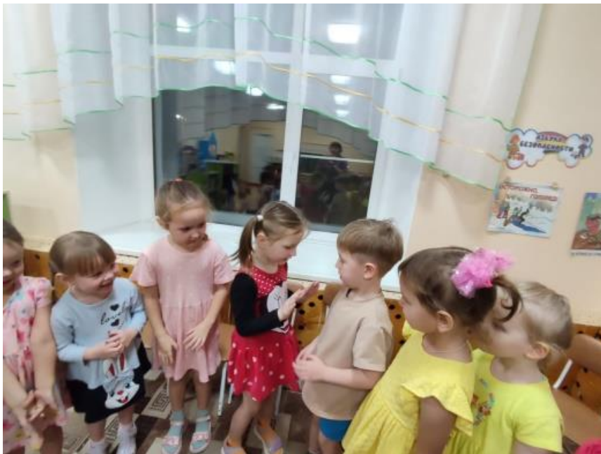
Рис.3. ООД «С чего начинается дружба?»