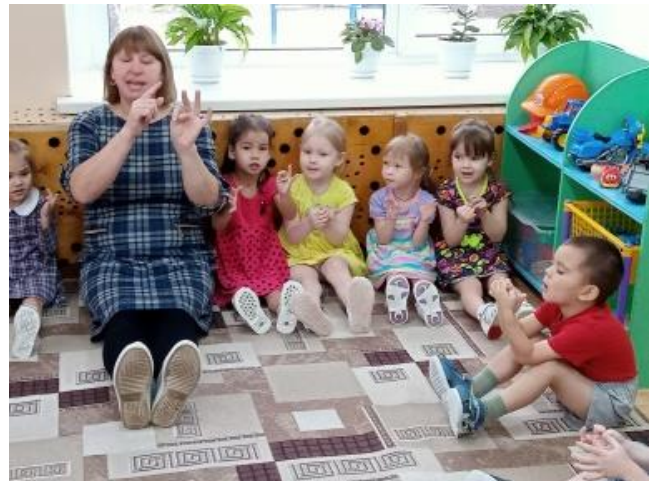
Рис.13. Пальчиковая игра «Дружные пальчики».