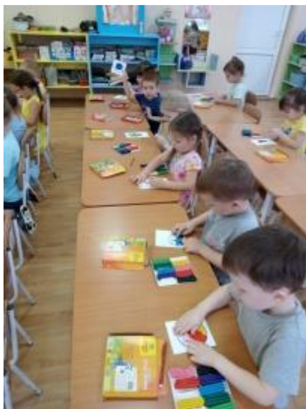
Рис.9. Лепка «Подарок другу».