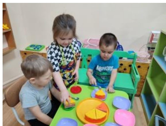
Рис.4. Сюжетно – ролевая игра «В гостях».