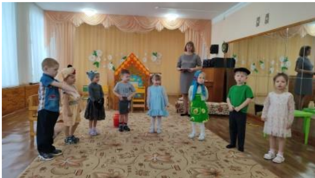
Рис.21. Инсценировка русской сказки «Про семью про дружную всем такую нужную».