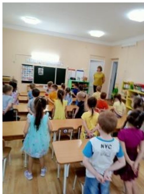
Рис.2. Слушание песен о дружбе: «Ты да я, да мы с тобой», «Когда мои друзья со мной», «Вместе весело шагать»...