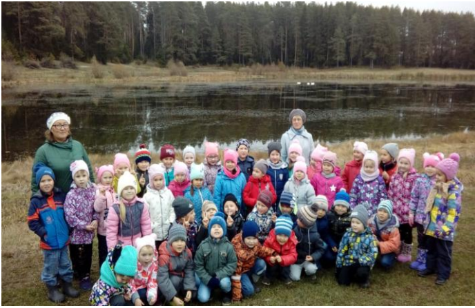
Экскурсия на природу