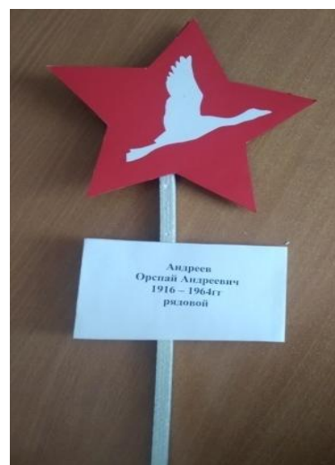
Табличка с именами участников Вов