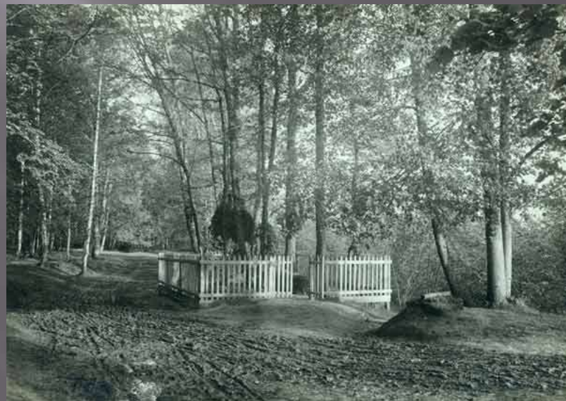
Могила Л.Н.Толстого в Ясной Поляне.