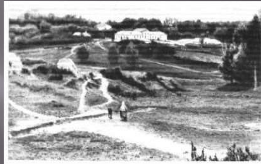
Вид на Красную Поляну.