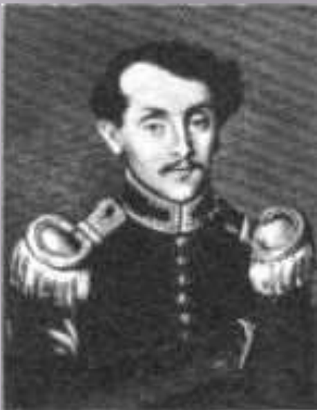
Николай Ильич, отец Л.Н.Толстого.