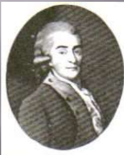
Николай Сергеевич Волконский, дед Л.Н. Толстого.

По своему происхождению Лев Николаевич принадлежал к знаменитым дворянским фамилиям Толстых (со стороны отца) и Волконских (со стороны матери), давших ряд государственных и военных деятелей известных в истории России.