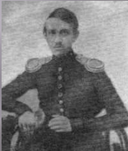
Брат писателя Н.Н.Толстой.

Под влиянием своего старшего брата Николая Л. Н. Толстой в 1851 году уезжает на Кавказ и поступает добровольцем на службу в артиллерию.