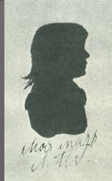
Мария Николаевна Волконская в детстве, мать Л.Н.Толстого.