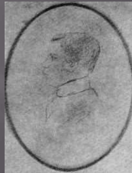
Л.Н.Толстой – студент.