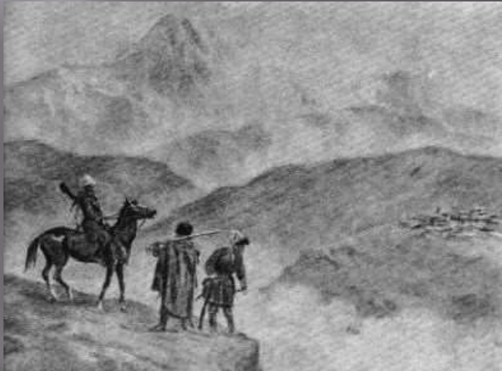
Вид на Кавказ.