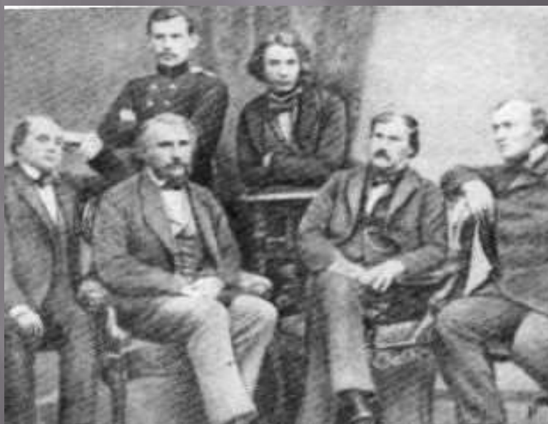
Л.Н.Толстой в группе писателей «Современника».

В Петербурге Тургенев ввел Толстого в круг известных литераторов, способствовал его литературному успеху. Особенно сблизился Толстой с писателями, группировавшимися вокруг «Современника».