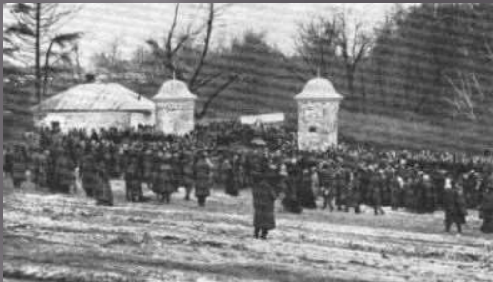
Похороны в Ясной Поляне.