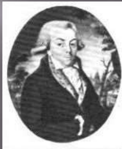
Илья Андреевич Толстой, дед Л.Н.Толстого.