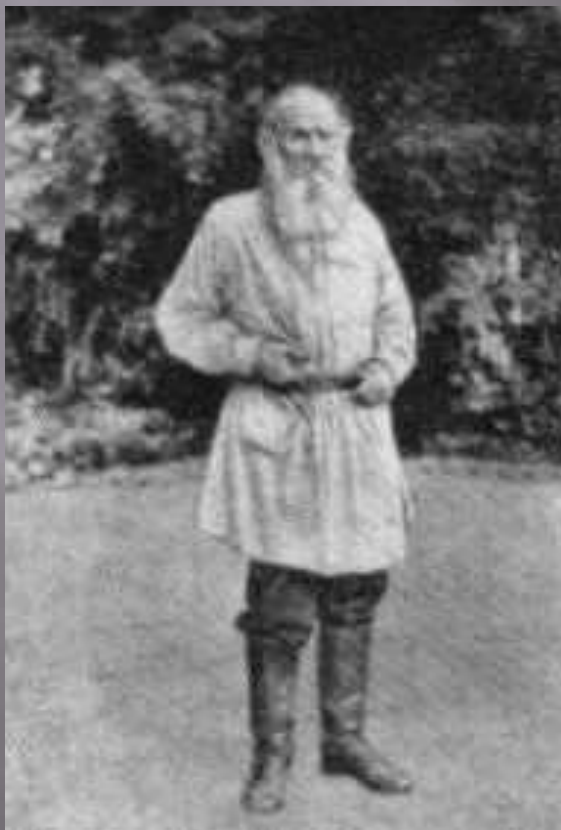
Л.Н. Толстой. 1895 год.

Л.Н.Толстой пишет статьи «За что?», «Не могу молчать!» и др.