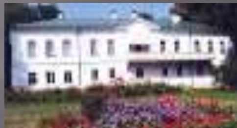
Дом в Ясной Поляне.