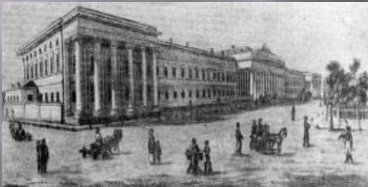
Здание Казанского университета.

В 1844 году Лев Николаевич поступает в Казанский университет на отделение восточных языков, затем переходит на юридический факультет. Казенное преподавание не удовлетворяло его пытливым ум, и в 1847 году Толстой подал прошение об увольнении его из числа слушателей.