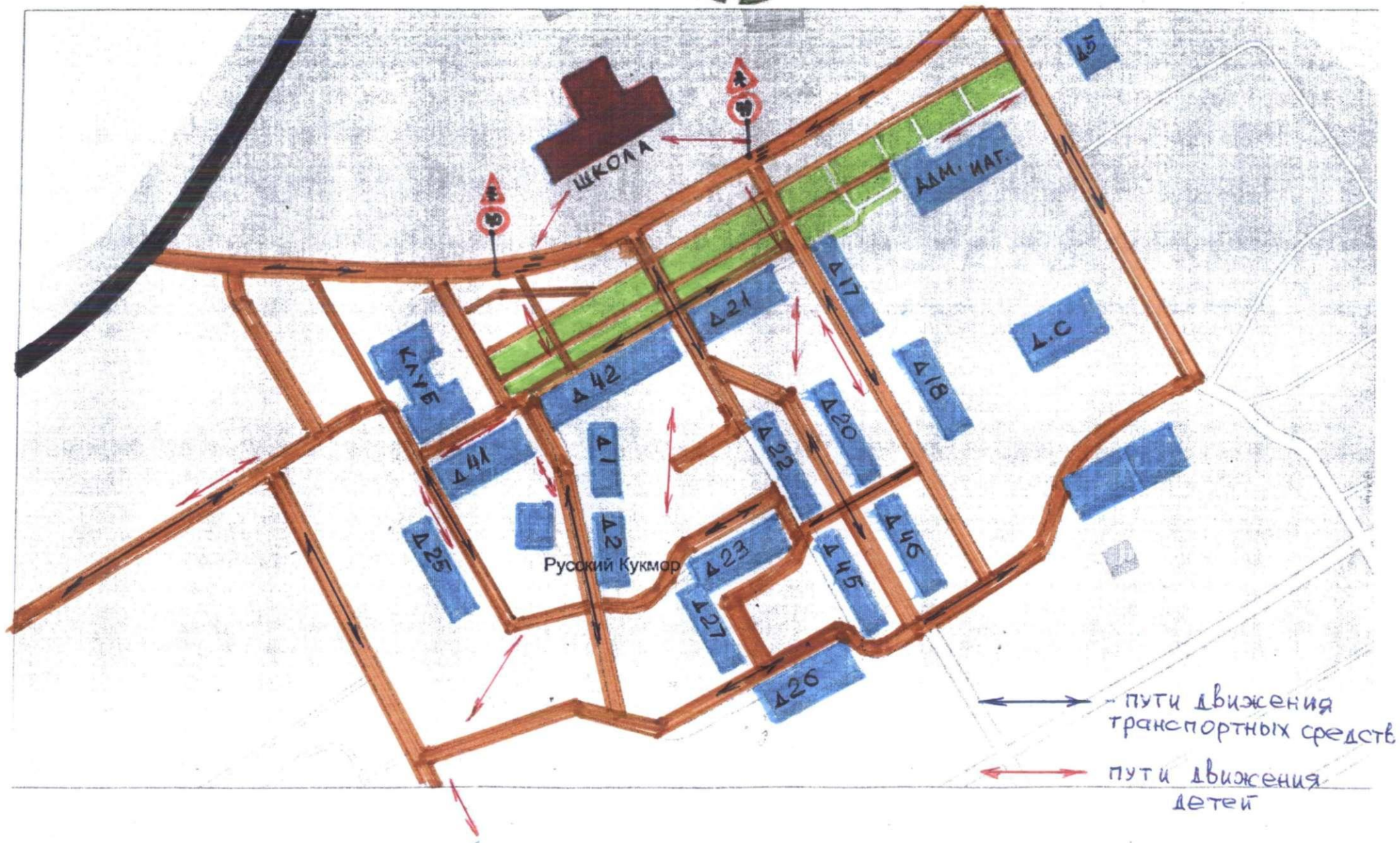
Схема безопасного движения в школу