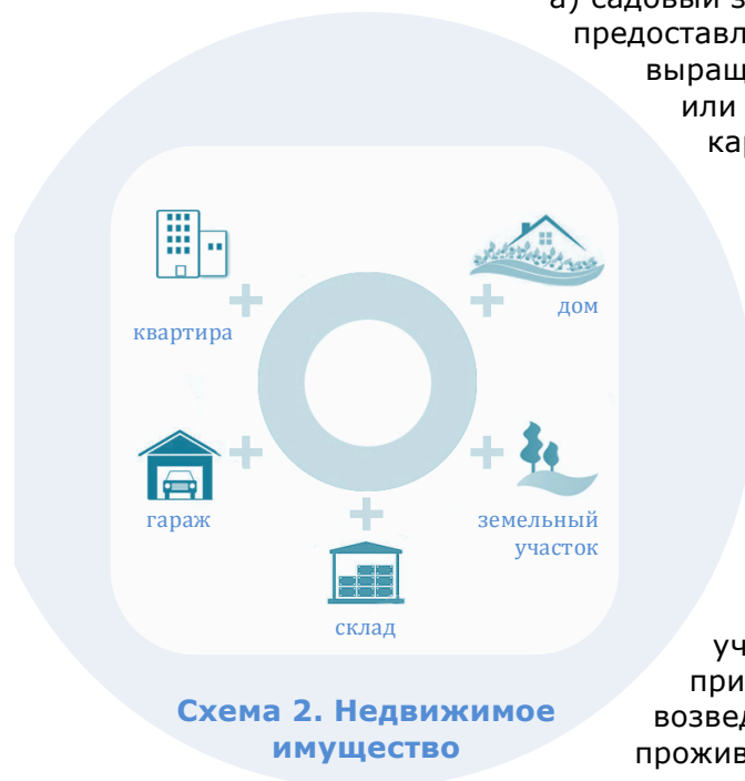
Схема 2. Недвижимое имущество

54. В соответствии со статьей 2 Федерального закона от 7 июля 2003 г. № 112-ФЗ «О личном подсобном хозяйстве» под личным подсобным хозяйством понимается форма непредпринимательской деятельности по производству и переработке сельскохозяйственной продукции. При этом для ведения личного подсобного хозяйства могут использоваться земельный участок в границах населенного пункта (приусадебный земельный участок) и земельный участок за пределами границ населенного пункта (полевой земельный участок). Приусадебный земельный участок используется для производства сельскохозяйственной продукции, а также для возведения жилого дома, производственных, бытовых и иных зданий, строений, сооружений с соблюдением градостроительных регламентов, строительных, экологических, санитарно-гигиенических,