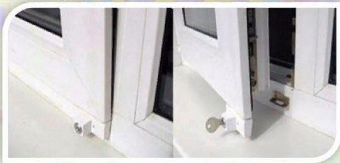
Замок блокировщик с ключом

Можно воспользоваться специальными замками блокираторами, которые предлагают установщики пластиковых окон.