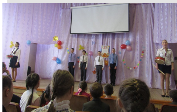
7 класс с песней «Шли солдаты» занял 2 место