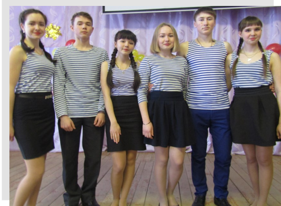
11 класс занял 2 место с пес- ней «Никто кроме нас»