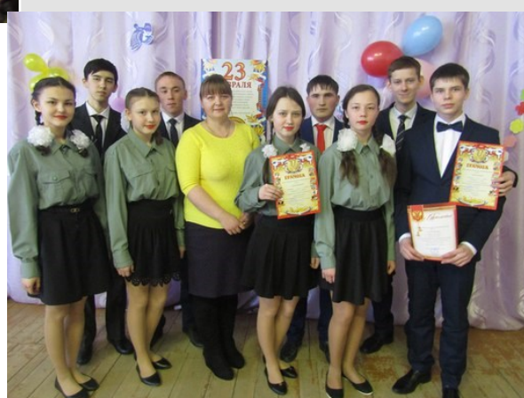
10 класс - победитель конкурса среди 8-11 классов с песней «Ах, эти тучи в голубом ...»