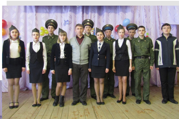
9 класс—победитель вне конкурса, ведущий мероприятия с песней « Потому, потому что мы пилоты...»