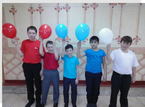
5 класс с песней «Российский флаг» занял 3 место