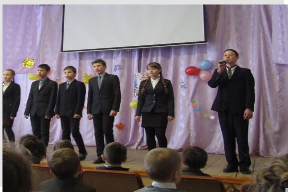
8 класс с песней «Мужчины за все в ответе» занял 3 место