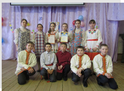
6 класс— победитель конкурса среди 5-7 классов