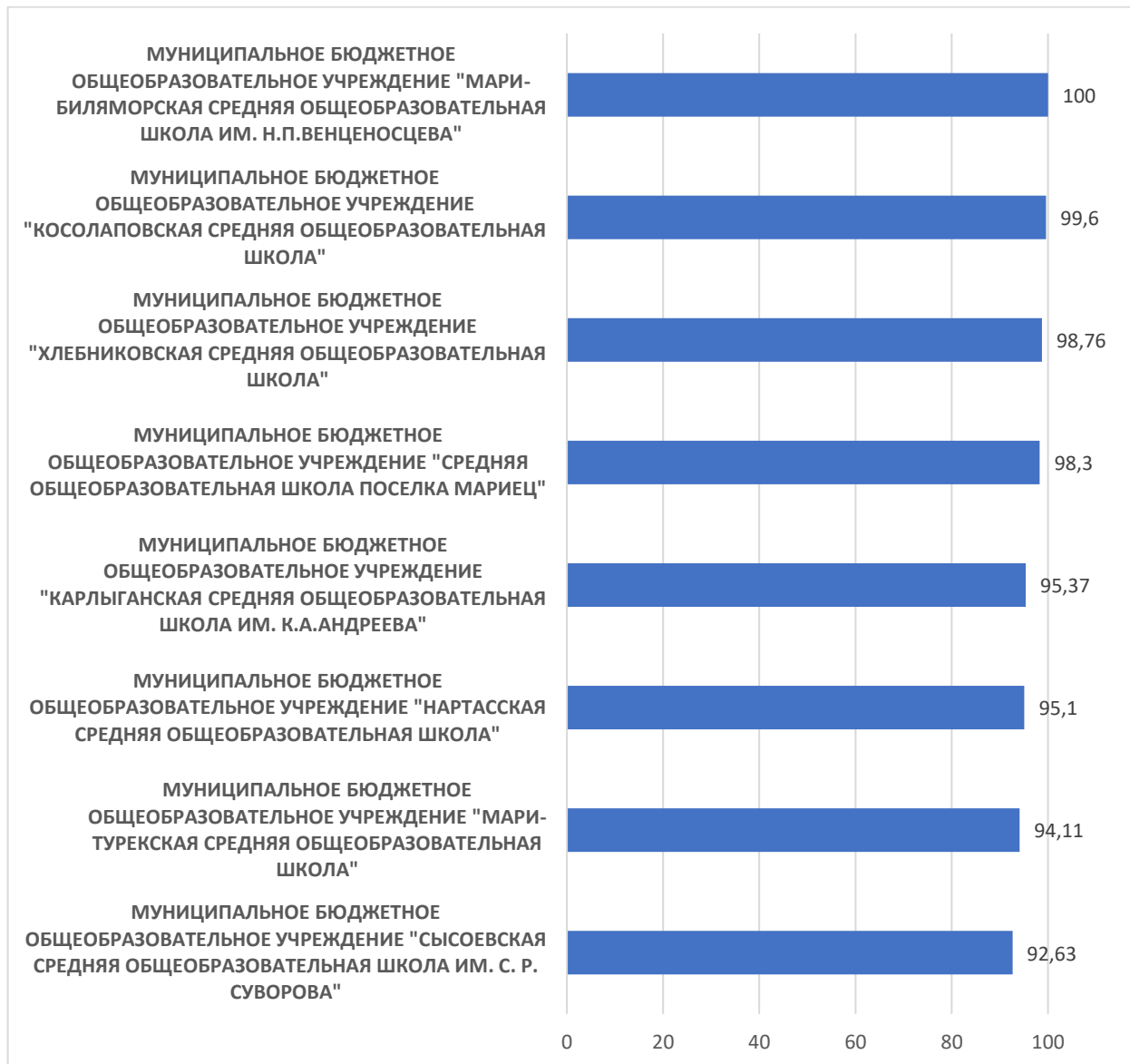
Рисунок 5 – Рейтинг организаций по критерию «Удовлетворенность условиями осуществления образовательной деятельности организаций»

По пятому критерию «Удовлетворенность условиями осуществления образовательной деятельности организаций» максимальный результат 100 баллов набрало МУНИЦИПАЛЬНОЕ БЮДЖЕТНОЕ ОБЩЕОБРАЗОВАТЕЛЬНОЕ УЧРЕЖДЕНИЕ "МАРИ-БИЛЯМОРСКАЯ