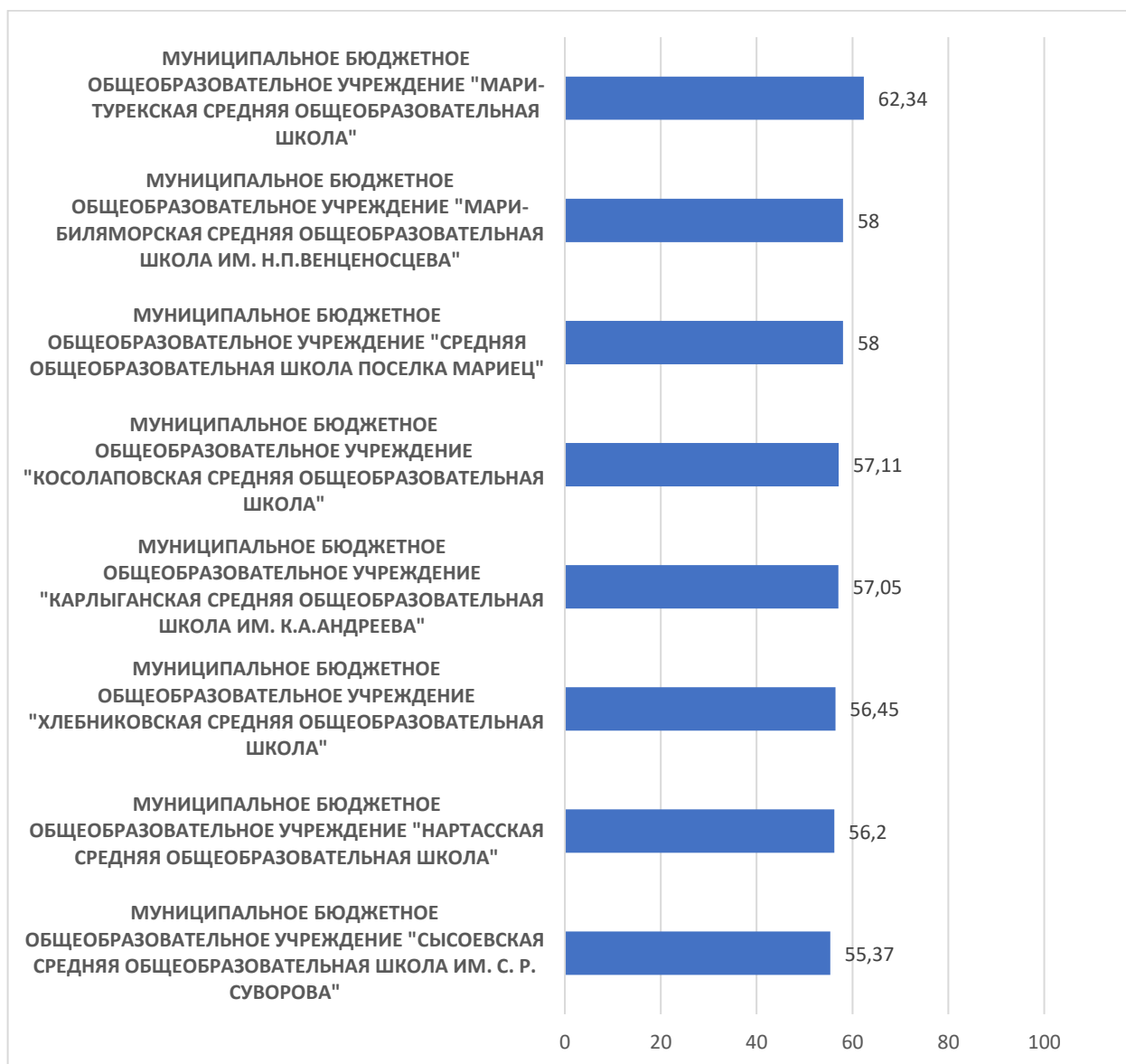
Рисунок 3 – Рейтинг организаций по критерию «Доступность образовательной деятельности для инвалидов»

По третьему критерию «Доступность образовательной деятельности для инвалидов» максимальный результат 62,34 балла набрало Муниципальное бюджетное общеобразовательное учреждение «Мари-Турекская средняя общеобразовательная школа» .