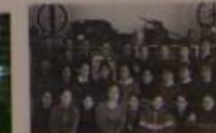
Совладелец анимационного мультимедиа 1995г. младшая группа.