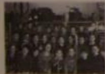
Совладелец анимационного мультимедиа 1995г. старшая группа.