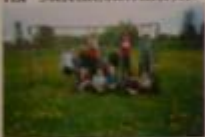
На фото: 2005 г. 4-й 6-го класса на стадионе, посвящённой в конце 60-х гг. Здесь проводились футбольные матчи 70-90 гг.

(Посланивание Ягодярова Р.И., 1939 г.р., ветерана спорта) В 1939 г. организовано включились в первенство района. В организации футбольных и волейбольных команд отличились учителя математики Ягодяров И.Я. и братья Ягодяровы.