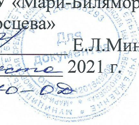
ГРАФИК ПРИЕМА ДЕТЕЙ В ШКОЛУ