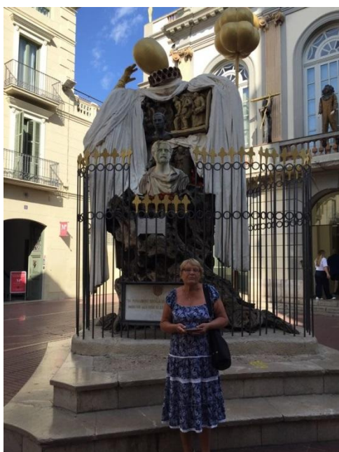
В музее Сальвадора Дали (Испания)