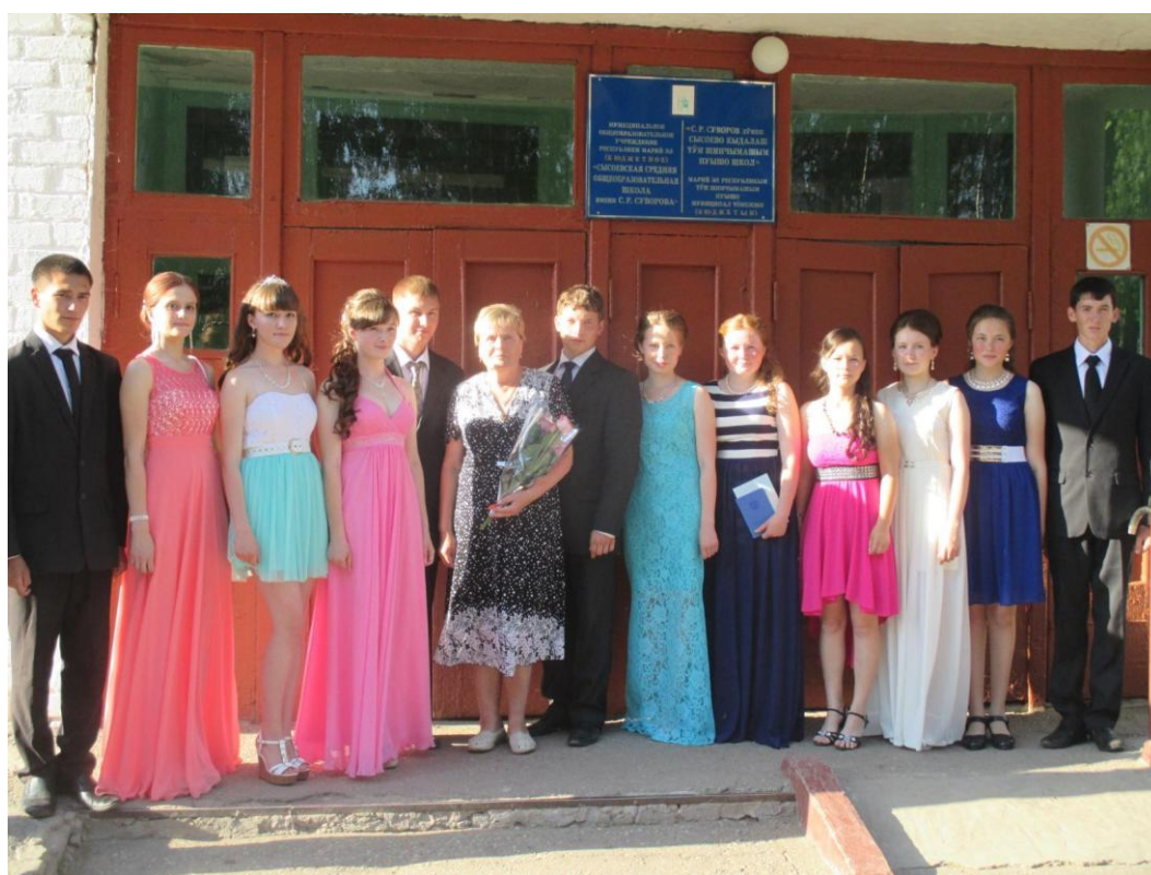
Мой выпуск, 2015год