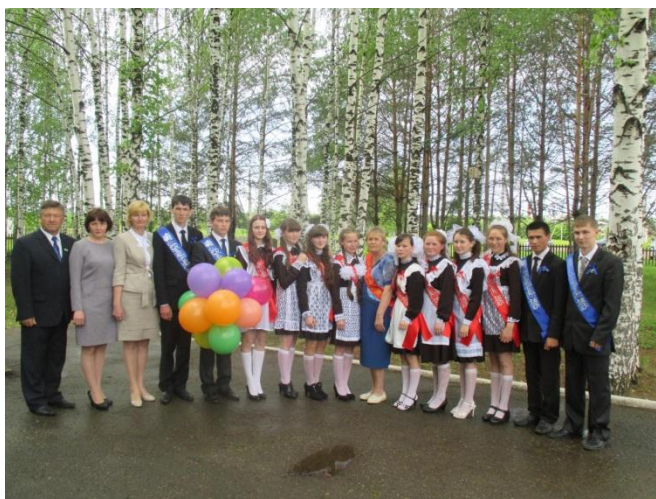
Последний звонок (2015г.)