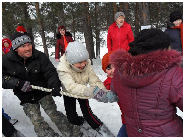
Зарница-любимая наша игра!