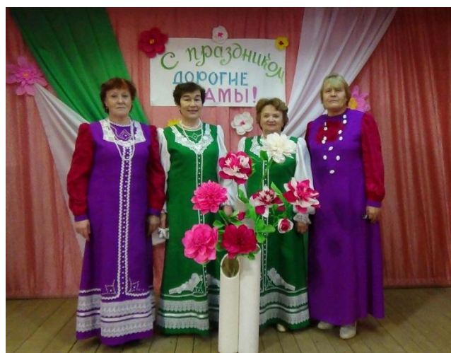
Ансамбль «Ивушки» Сысоевский СДК