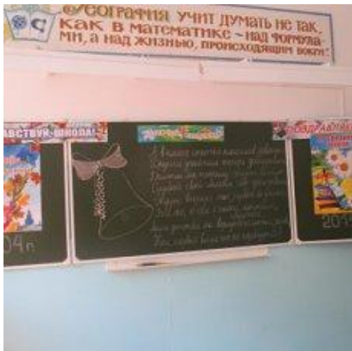
К последнему звонку готовы!