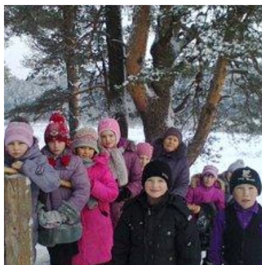
На зимней экскурсии