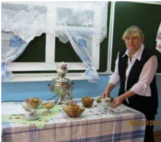
Урок ИКН «Посиделки в русской избе»