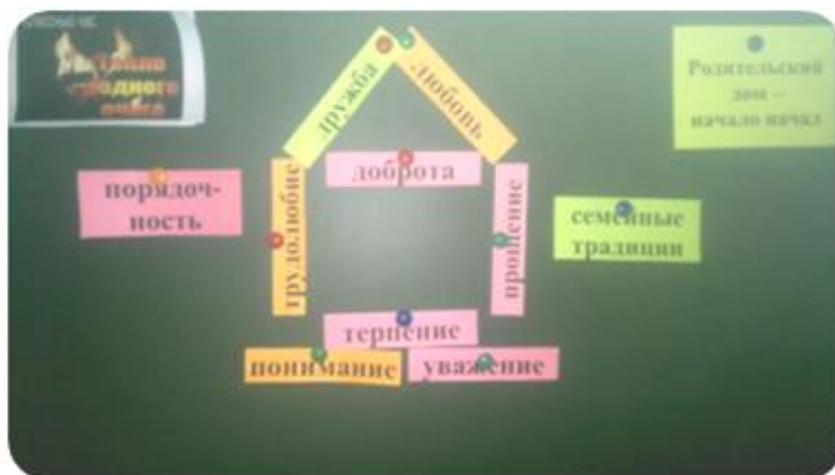
Приложение № 3