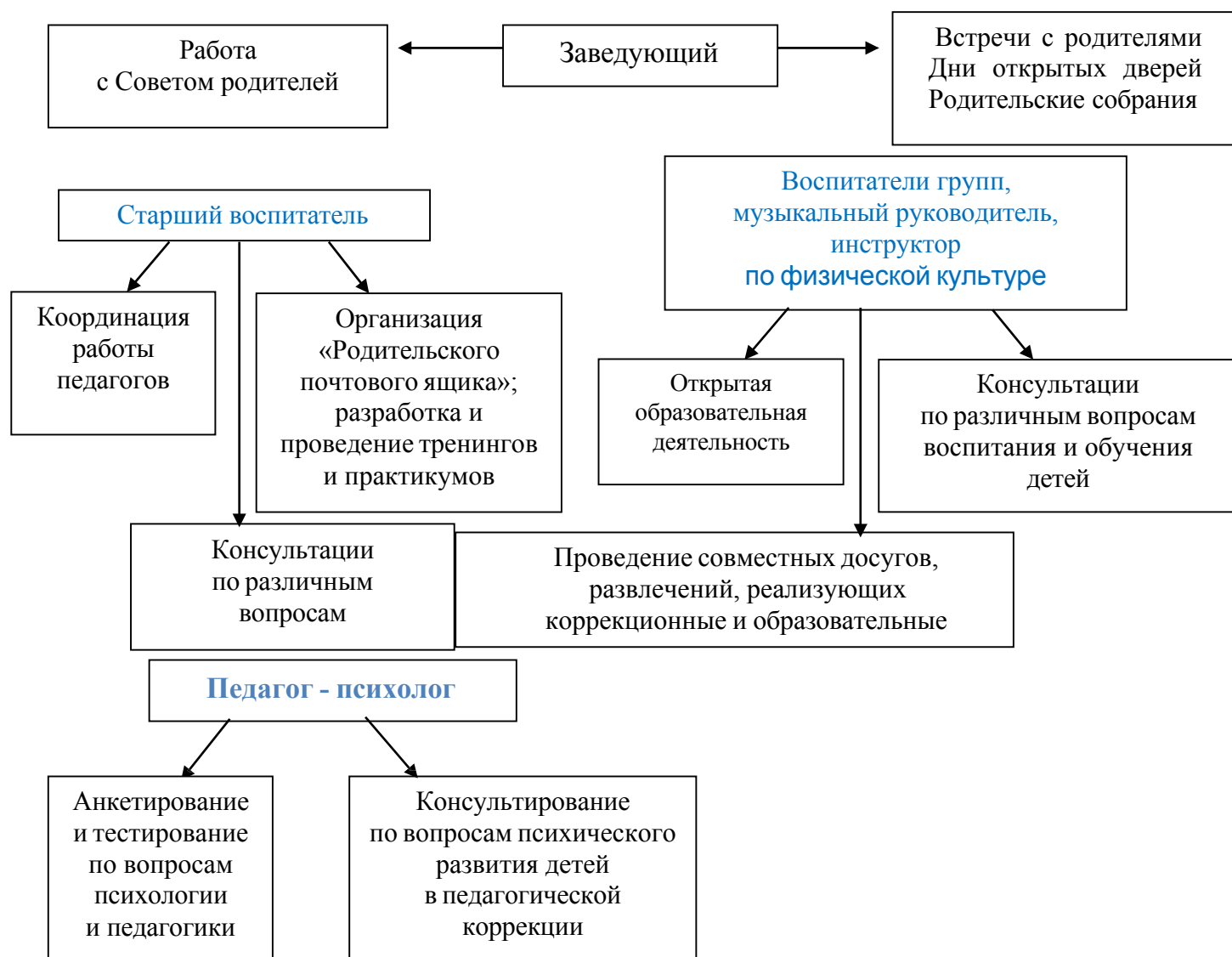
Рис. 1 «Схема взаимодействия с семьями воспитанников»