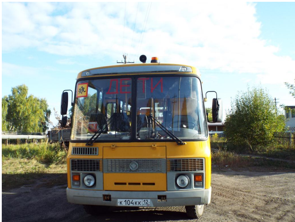
ПАЗ 32063-70 г/н К104КК/12 RUS