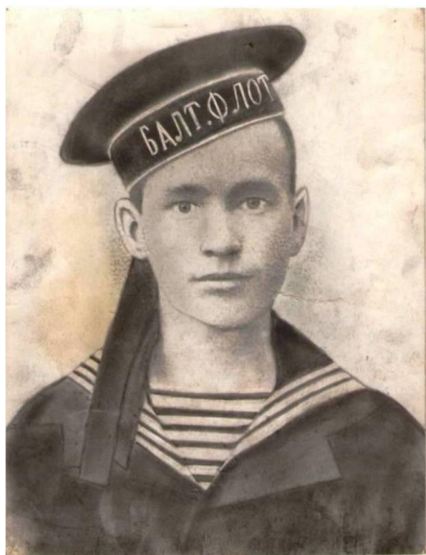
Рисунок 1.

Данный краеведческий материал могут использовать в своей работе не только учителя Горномарийского района Республики Марий Эл, но и коллеги из других регионов, так как на этом примере отражаются события, которые происходили по всей нашей огромной стране в те далёкие тревожные годы становления советской власти, во время репрессий.