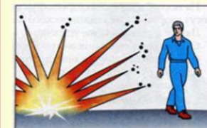
Опасная поза при взрыве